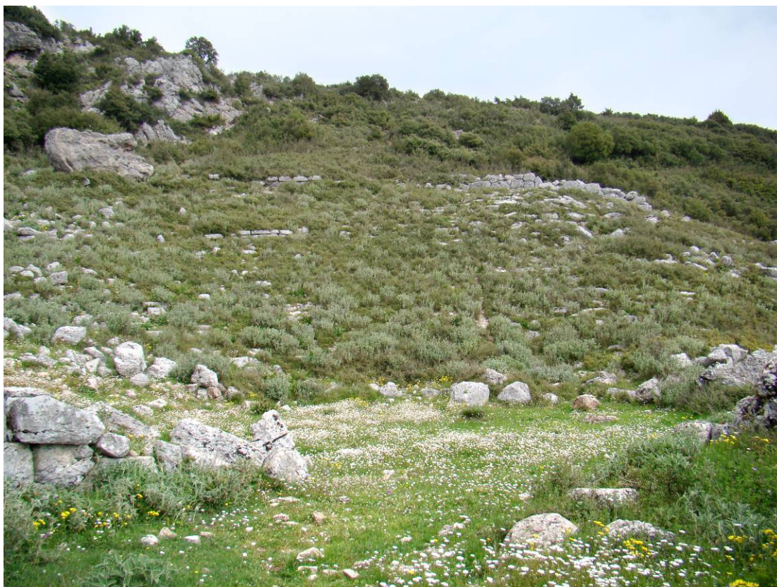
Γενική άποψη του κοίλου και της ορχήστρας του Θεάτρου

Δύο πολυγωνικά αναλήμματα, ενισχυμένα με αντηρίδες στηρίζουν τα δύο άκρα του κοίλου, που χωρίζεται από ενδιάμεσο διάζωμα σε δύο τμήματα με είκοσι τέσσερις (24) σειρές λίθινων εδωλίων κάτω και δώδεκα (12) σειρές επάνω αντίστοιχα.