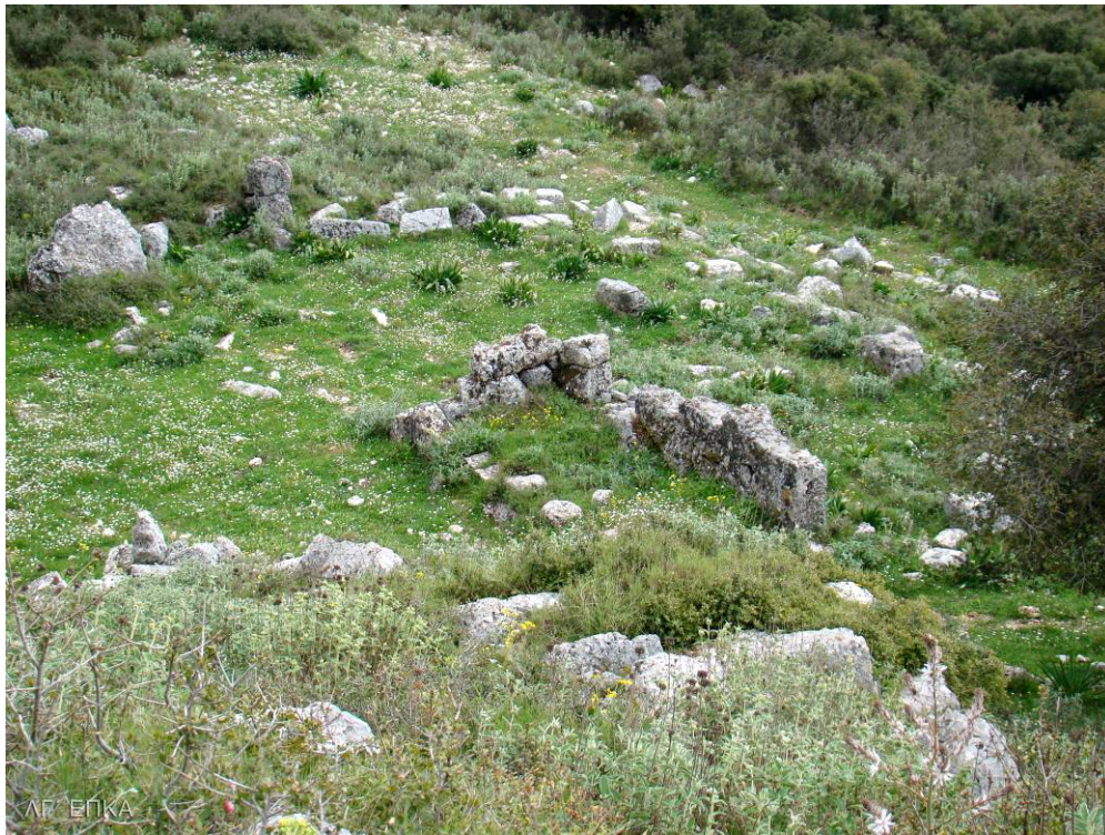
Λεπτομέρεια της σκηνής του Θεάτρου

Η σκηνή είναι ορθογώνια και πλαισιώνεται από δύο παρασκήνια, που προεξείχαν εκατέρωθεν προς την ορχήστρα, μεταξύ των οποίων αναπτύσσεται προσκήνιο με έξι κίονες στην πρόσοψη. Η χωρητικότητα του Θεάτρου υπολογίζεται σε 5.000 ~ 6000 θεατές.