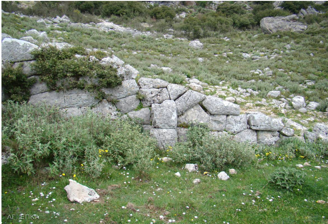
Όψη πολυγωνικού αναλήμματος

Στην κορυφή του κοίλου ένα πλατύτερο διάζωμα προστατεύεται εξωτερικά από τοίχο, ο οποίος φέρει άνοιγμα, που διευκόλυνε πιθανότατα την έξοδο των θεατών από το ανώτερο τμήμα του Θεάτρου.