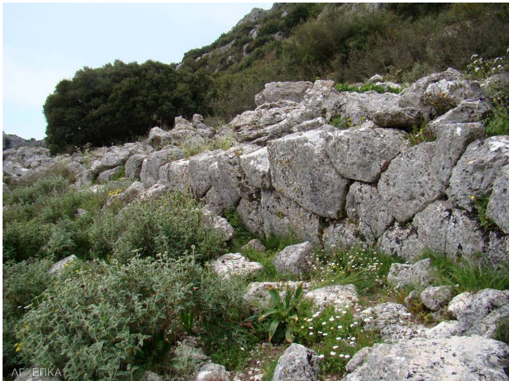
Ανώτερο τμήμα του κοίλου του Θεάτρου. Πολυγωνική τοιχοποιία

Στην κορυφή του κοίλου ένα πλατύτερο διάζωμα προστατεύεται εξωτερικά από τοίχο, ο οποίος φέρει άνοιγμα, που διευκόλυνε πιθανότατα την έξοδο των θεατών από το ανώτερο τμήμα του Θεάτρου.