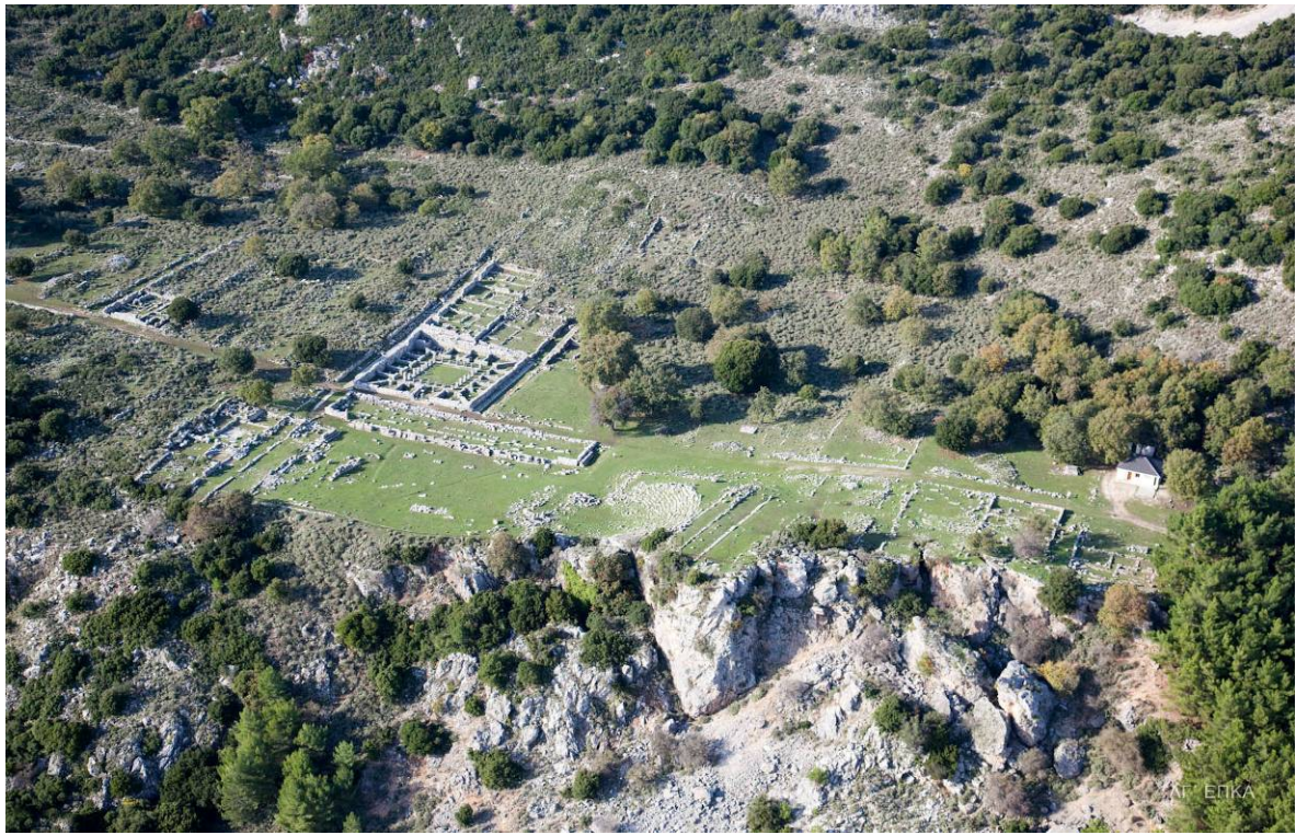
Η Αγορά της Κασσώπης

Το χώρο αυτό, που από τα τέλη του 3 ου – αρχές 2 ου αι. π.Χ. έμελε να λάβει μνημειακή διαμόρφωση, περιέβαλαν δύο Στοές, το Πρυτανείο και το λεγόμενο μικρό θέατρο ή Βουλευτήριο. Η πόλη ωστόσο διέθετε και άλλα δημόσια, εξίσου σημαντικά, οικοδομήματα, όπως ο Ναός της Αφροδίτης, ένας μικρών διαστάσεων περίπτερος δωρικός ναός ‘εν παραστάσι’, το Καταγώγιο, που πιθανότατα αποτελούσε το δημόσιο ξενώνα της πόλης ή την εμπορική της αγορά και το μεγάλο Θέατρο, χωρητικότητας 5000 ~ 6000 θεατών.