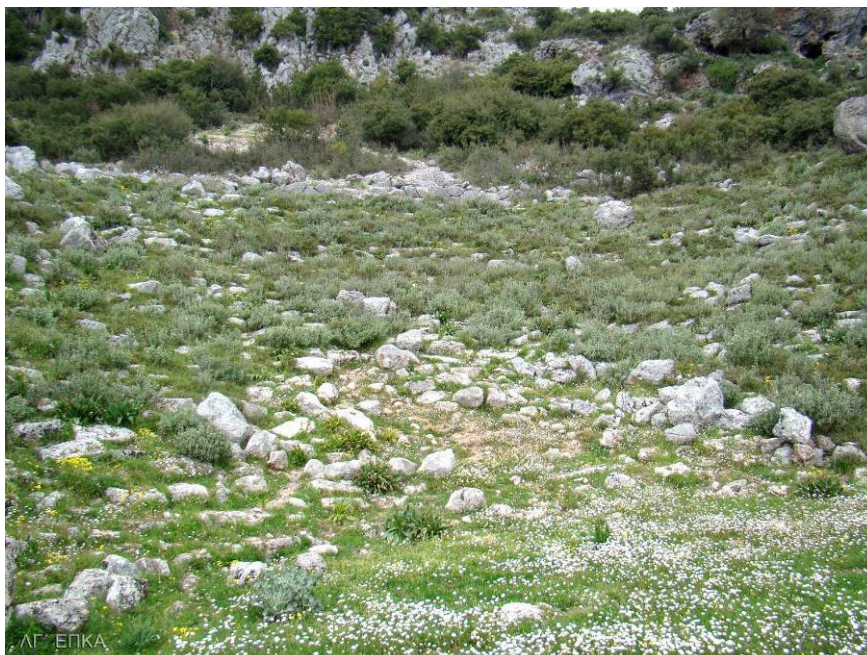
Καταστροφή σειρών εδωλίων του Θεάτρου από τις κατακρημνίσεις βράχων

β). Υφιστάμενη κατάσταση. Στο πέρασμα των χρόνων και με την εγκατάλειψη της αρχαίας πόλης, το Θέατρο της Κασσώπης καλύφθηκε από οργιώδη βλάστηση, η οποία σε συνδυασμό με τις συνεχείς κατακρημνίσεις βράχων κατέστρεψαν σημαντικά τμήματα των εδωλίων του κοίλου, το οποίο καλύπτεται σήμερα σε όλη την έκτασή του από σύγχρονες επιχώσεις.