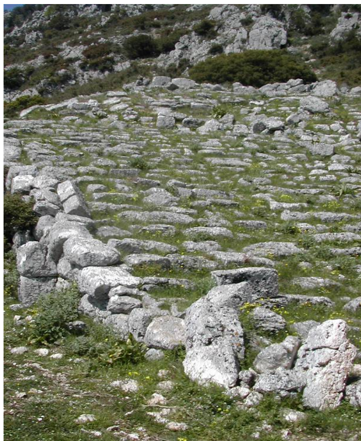
Σειρές εδωλίων Θεάτρου με μία από τις κλίμακες

Έντεκα (11) κλίμακες διαιρούσαν το κοίλο σε δέκα (10) κερκίδες, με τις δύο ακρινές να έχουν το μισό πλάτος από τις υπόλοιπες.