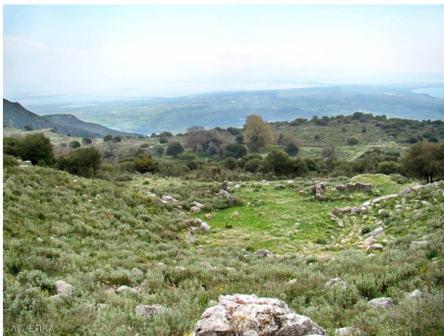
Γενική άποψη του κοίλου, της ορχήστρας και του σκηνικού οικοδομήματος του Θεάτρου

Ιδιομορφία παρουσιάζει η ορχήστρα του Θεάτρου καθώς δε σχηματίζει πλήρη κύκλο, αλλά τόξο μεγαλύτερο από το ημικύκλιο.