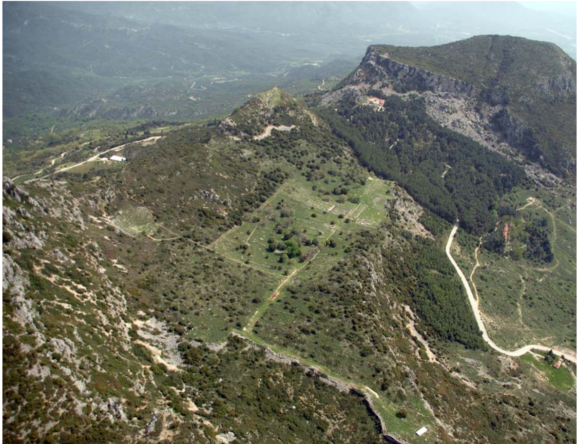
Αεροφωτογραφία του αρχαιολογικού χώρου

α). Γενική περιγραφή του χώρου. Σε ένα επίπεδο οροπέδιο έκτασης 350 περίπου στρεμμάτων, στις νότιες υπώρειες του Ζαλόγγου, σε φυσικά οχυρή και στρατηγική θέση, ιδρύθηκε από το θεσπρωτικό φύλο των Κασσωπαίων, με το συνοικισμό κωμών, στο α΄ μισό του 4 ου αι. π.Χ. η Κασσώπη. Η πόλη βρισκόταν στο κεντρικό τμήμα της αρχαίας Κασσωπαίας, τα γεωγραφικά όρια της οποίας ταυτίζονται σε γενικές γραμμές με τα σημερινά διοικητικά όρια του Νομού Πρέβεζας. Μέσα σε σύντομο χρονικό διάστημα η Κασσώπη αποτέλεσε το διοικητικό, πολιτικό, θρησκευτικό και οικονομικό κέντρο των Κασσωπαίων.