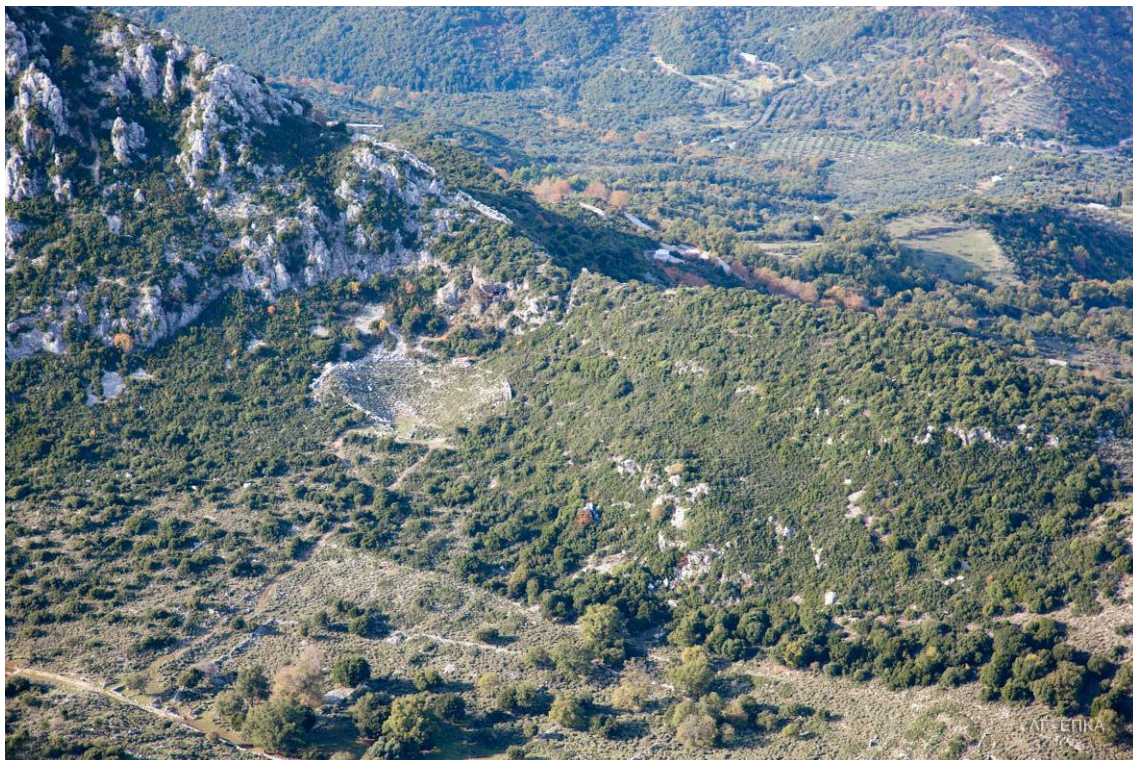
Αεροφωτογραφία του Θεάτρου

Δύο πολυγωνικά αναλήμματα, ενισχυμένα με αντηρίδες στηρίζουν τα δύο άκρα του κοίλου, που χωρίζεται από ενδιάμεσο διάζωμα σε δύο τμήματα με είκοσι τέσσερις (24) σειρές λίθινων εδωλίων κάτω και δώδεκα (12) σειρές επάνω αντίστοιχα.