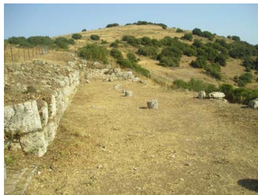
Το 'Βουλευτήριο'.