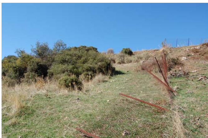
Υπάρχουσα κατάσταση και προβλήματα της νότιας πλευράς της περίφραξης του Θεάτρου.