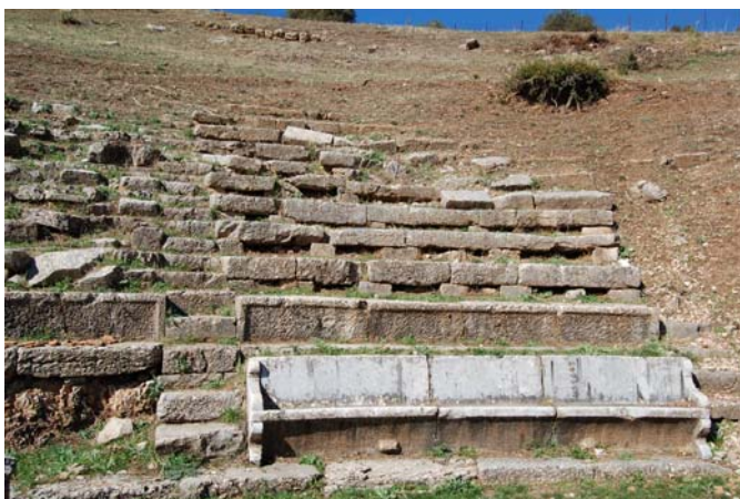
Άποψη της κεντρικής κερκίδας του Θεάτρου. Τα κατά χώραν σωζόμενα edwlia συνυπάρχουν με διάσπαρτα ή θραύσματά τους. (Πηγή: ΛΘ' ΕΠΚΑ)