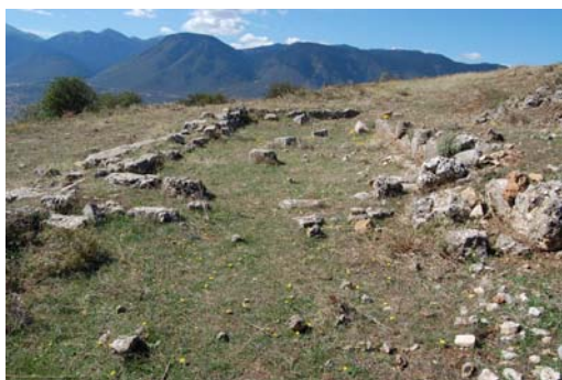
Ναός Αρτεμης Μεσοπολίτιδος.

Το πιο γνωστό, όμως, μνημείο της Αγοράς του Ορχομενού είναι το Θέατρο, το οποίο καταλαμβάνει τμήμα της ανατολικής πλαγιάς του λόφου.