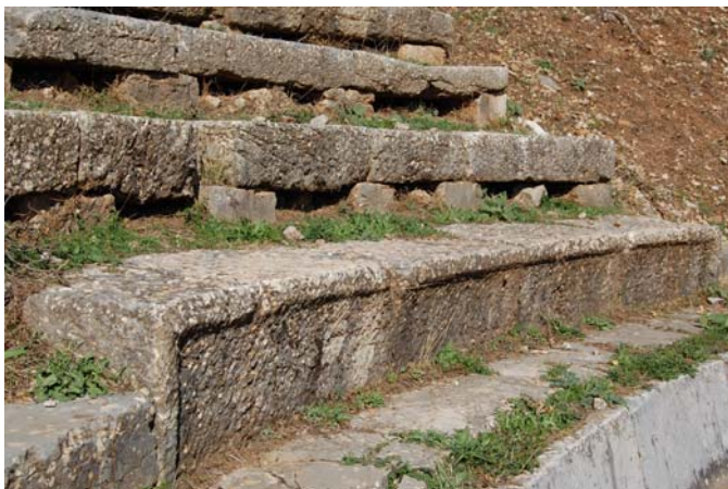
Η δεύτερη σειρά καθισμάτων σύνθετης διατομής. (Πηγή: ΛΘ' ΕΠΚΑ)