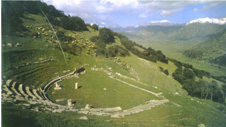
ΝΔ άποψη του Θεάτρου.