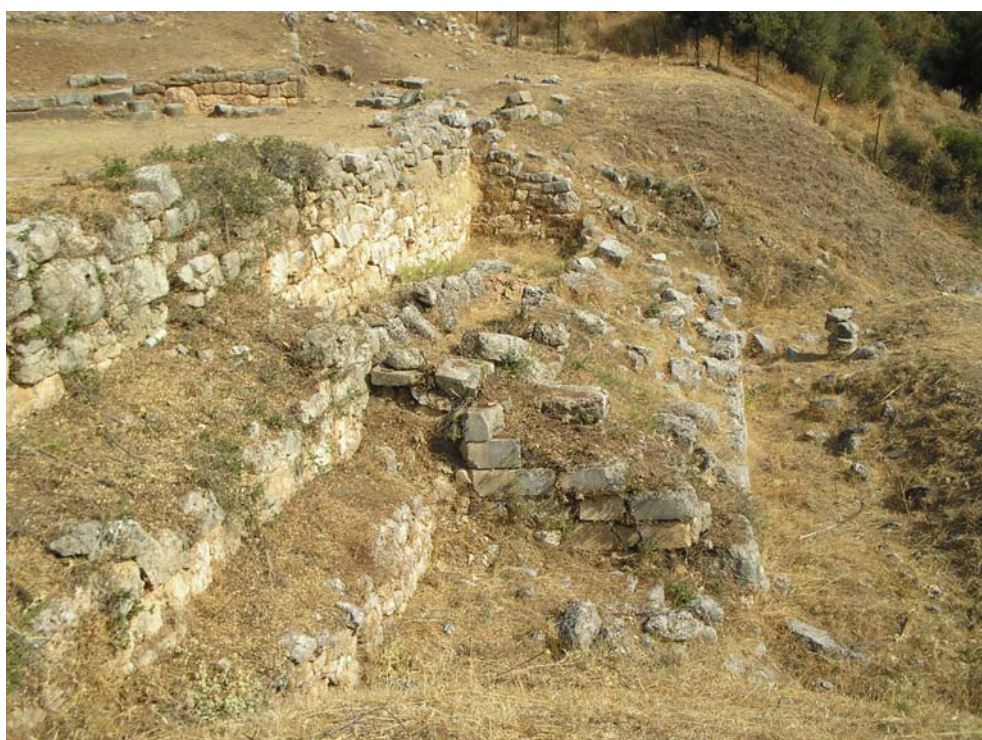
Οι αναλημματικοί τοίχοι που στηρίζουν το συγκρότημα σκηνής-προσκηνίου.

Το συγκρότημα προσκηνίου-σκηνής είναι λίθινο. Το προσκήνιο, που καταλαμβάνει και τμήμα της ορχήστρας, αποτελεί μία στοά μήκους 13.35 μ. και πλάτους 3μ. περίπου, της οποίας είναι ορατός μόνο ο στυλοβάτης αποτελούμενος από ασβεστολιθικές πλάκες. Κατά τους Γάλλους ανασκαφείς, έντεκα μαρμαρίνες βάσεις κίωνων ήταν αρχικά τοποθετημένες επί του στυλοβάτη σε απόσταση 1.17μ. η μία από την άλλη. Ήταν τετράγωνου σχήματος, με μήκος πλευράς 0.32μ. και έφεραν ξύλινους κίονες, που με τη σειρά τους κατά πάσα πιθανότητα στήριζαν ένα ξύλινο λογείο. Από αυτές τις βάσεις σήμερα σώζεται μόνο μία, μετακινημένη μέσα στην ορχήστρα.