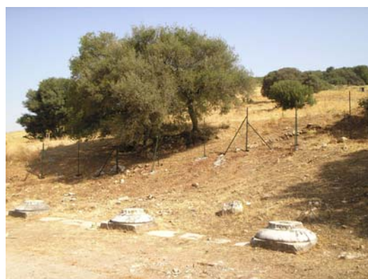
Θεμέλια του αρχαϊκού δωρικού ναού στο σημερινό χωριό του Ορχομενού.