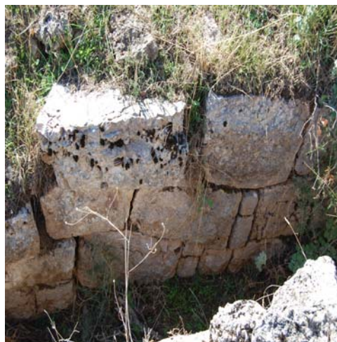
Ο λίθινος κτιστός αγωγός απορροής όμβριων υδάτων και λεπτομέρεια από την τοιχοποιία της.

Το σύστημα περιελάμβανε επίσης μικρότερους αγωγούς απορροής των υδάτων που είναι επίσης λίθινης κατασκευής. Ένας από αυτούς, πλάτους 0.20μ. περίπου, ακολουθεί πορεία παράλληλη προς το ανατολικό ανάλημμα του κοίλου σε μήκος 7μ. περίπου. Ο οχετός της ορχήστρας δεν έχει προς το παρόν αποκαλυφθεί αλλά ένα μικρό τμήμα του είναι ορατό στο νοτιοανατολικό άκρο του κοίλου.