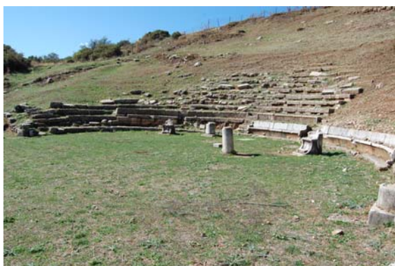
Το αρχαίο θέατρο του Ορχομενού.

Ο λόφος αυτός φιλοξενεί στα πόδια του το χωριουδάκι του Ορχομενού, γνωστό στους ντόπιους και με το παλαιότερο όνομα Καλπάκι. Από εκεί ο επισκέπτης ακολουθεί έναν ανηφορικό χωματόδρομο και, ύστερα από 1.5 χλμ. εισέρχεται στον αρχαιολογικό χώρο. Το πρώτο μνημείο που συναντά σήμερα κανείς είναι το Θέατρο της αρχαίας αρκαδικής πόλης. Η θέα από το μνημείο αυτό στον κάμπο του Ορχομενού κόβει την ανάσα και αποζημιώνει τον επισκέπτη από την πεζοπορία.