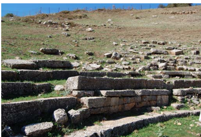
Άποψη της πρώτης από Ν. κερκίδας του Θεάτρου που παρουσιάζει έντονη εικόνα αποδιοργάνωσης.

Το ανάλημμα της ορχήστρας του μνημείου παρουσιάζει προβλήματα ευστάθειας. Την άσχημη εικόνα στο σημείο αυτό επιτείνουν και οι μεγάλοι σωροί από τα μπάζα των παλαιότερων ανασκαφών στην περιοχή του κοίλου, τα οποία αποτέθηκαν πρόχειρα στην πλαγιά όπου και το ανάλημμα της ορχήστρας.