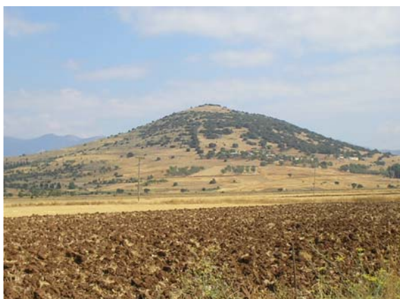
Άποψη του λόφου του Ορχομενού.