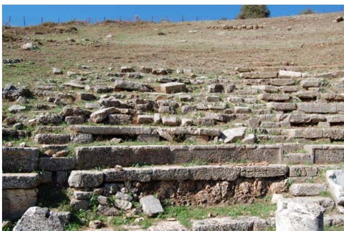
Άποψη της δεύτερης από Ν κερκίδας. Εδώ το κάθισμα της προεδρίας δε σώζεται πλέον.