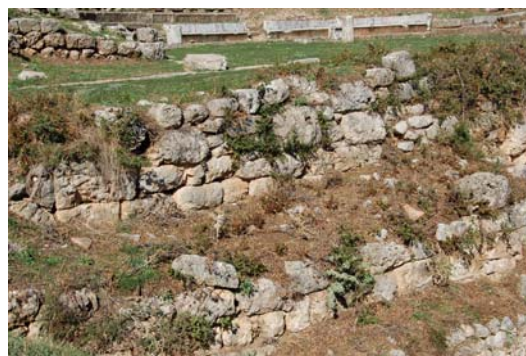
Λεπτομέρεια από την τοιχοποιία της σκηνής.

Η σκηνή κατά τις ανασκαφές αποκαλύφθηκε στο ύψος της θεμελίωσης. Είναι ομοίως κατασκευασμένη από ασβεστόλιθο και αποτελείται από δύο παράλληλους μεταξύ τους ορθογώνιους χώρους, μήκους 13.25μ. και πλάτους 3.10 και 4.20μ. αντίστοιχα. Λόγω της απότομης κλίσης της πλαγιάς φαίνεται ότι τμήμα του συγκροτήματος της σκηνής λειτουργούσε και ως ανάλημμα.