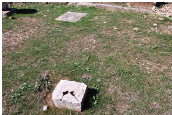
Μία από τις βάσεις των ξύλινων κιόνων του προσκηνίου.

Η σκηνή κατά τις ανασκαφές αποκαλύφθηκε στο ύψος της θεμελίωσης. Είναι ομοίως κατασκευασμένη από ασβεστόλιθο και αποτελείται από δύο παράλληλους μεταξύ τους ορθογώνιους χώρους, μήκους 13.25μ. και πλάτους 3.10 και 4.20μ. αντίστοιχα. Λόγω της απότομης κλίσης της πλαγιάς φαίνεται ότι τμήμα του συγκροτήματος της σκηνής λειτουργούσε και ως ανάλημμα.