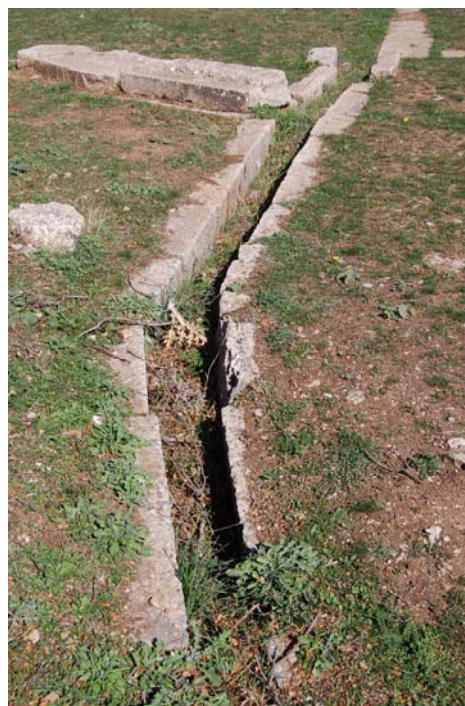
Άποψη λίθινου αγωγού αποστράγγισης υδάτων.

Το σύστημα περιελάμβανε επίσης μικρότερους αγωγούς απορροής των υδάτων που είναι επίσης λίθινης κατασκευής. Ένας από αυτούς, πλάτους 0.20μ. περίπου, ακολουθεί πορεία παράλληλη προς το ανατολικό ανάλημμα του κοίλου σε μήκος 7μ. περίπου. Ο οχετός της ορχήστρας δεν έχει προς το παρόν αποκαλυφθεί αλλά ένα μικρό τμήμα του είναι ορατό στο νοτιοανατολικό άκρο του κοίλου.