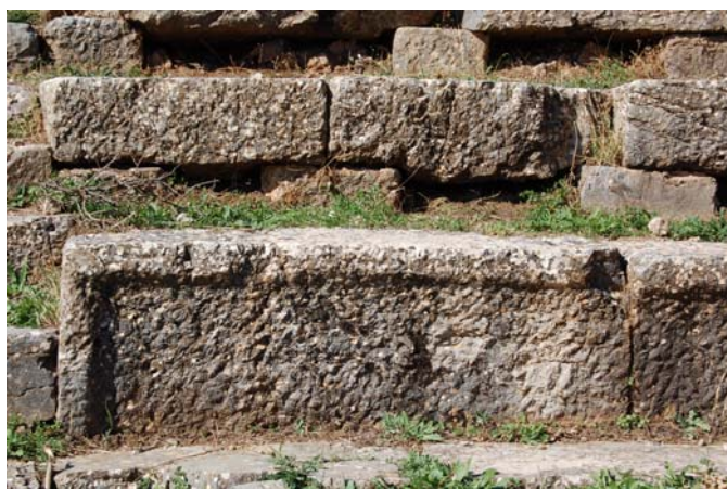
Λεπτομέρεια από τα καθίσματα της δεύτερης και τρίτης σειράς.