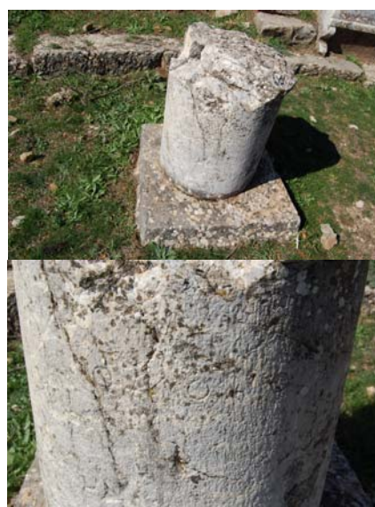
Ο βωμός που διασώζει την επιγραφή: Ομονοίας .