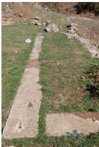
Ο στυλοβάτης του προσκηνίου.