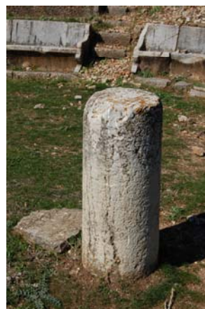
Αριστερά: Άποψη της ορχήστρας από την προεδρία. Δεξιά: Αράβδωτος κίονας στην ορχήστρα.

Το συγκρότημα προσκηνίου-σκηνής είναι λίθινο. Το προσκήνιο, που καταλαμβάνει και τμήμα της ορχήστρας, αποτελεί μία στοά μήκους 13.35 μ. και πλάτους 3μ. περίπου, της οποίας είναι ορατός μόνο ο στυλοβάτης αποτελούμενος από ασβεστολιθικές πλάκες. Κατά τους Γάλλους ανασκαφείς, έντεκα μαρμαρίνες βάσεις κίωνων ήταν αρχικά τοποθετημένες επί του στυλοβάτη σε απόσταση 1.17μ. η μία από την άλλη. Ήταν τετράγωνου σχήματος, με μήκος πλευράς 0.32μ. και έφεραν ξύλινους κίονες, που με τη σειρά τους κατά πάσα πιθανότητα στήριζαν ένα ξύλινο λογείο. Από αυτές τις βάσεις σήμερα σώζεται μόνο μία, μετακινημένη μέσα στην ορχήστρα.