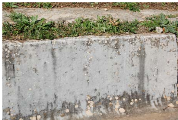
Λεπτομέρεια από την επιγραφή: [ο δέινα] Επιγένεος αγωνοθετήσας Διονύσωι .

Από επιτόπιες παρατηρήσεις προκύπτει ότι τα εδώλια της δεύτερης σειράς είναι πιο επιμελημένα από αυτά των υπολοίπων σειρών. Τα εδώλια αυτά είναι σύνθετης διατομής, αποτελούνται δηλαδή από το καθαυτό κάθισμα πάνω στο οποίο κάθετοι ο θεατής και από την πλάκα του διαδρόμου που λειτουργεί ως υποπόδιο. Στην άνω επιφάνεια του κυρίως καθίσματος δεν υπάρχει η φαρδιά εγκοπή που συναντάται συνήθως κατά μήκος της οπίσθιας παρυφής του. Χαρακτηριστική επίσης είναι η πρόσθια όψη των καθισμάτων. Μία ταινία περιτρέχει την άνω οριζόντια πλευρά όλων των εδωλίων καθώς και τις εξωτερικές κάθετες πλευρές των δύο γωνιακών καθισμάτων της κάθε κερκίδας. Η επιφάνεια του λίθου παραμένει αδρά λαξευμένη και παρουσιάζει