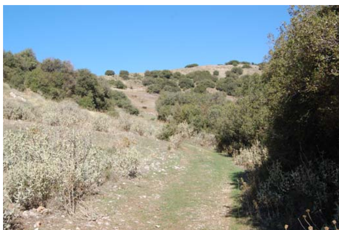
Το μονοπάτι που οδηγεί στο Θέατρο.