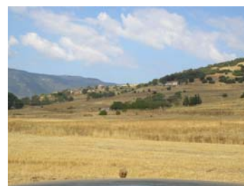
Το σημερινό χωριό του Ορχομενού στις υπώρειες του λόφου.

Πολύτιμες πληροφορίες για την ιστορική διαδρομή και τα δημόσια μνημεία της αρχαίας αυτής πόλης προσφέρει ο περιηγητής Πausanias (8.13). Οι παλαιότερες μέχρι στιγμής ενδείξεις για κατοίκηση στην πεδιάδα του Ορχομενού ανάγονται στη μυκηναϊκή περίοδο. Κατά τους ιστορικούς χρόνους ο Ορχομενός αποτέλεσε μία από τις τρεις κραταιές πόλεις – κράτη της ανατολικής Αρκαδίας. Οι άλλες δύο ήταν η Τεγέα και η Μαντίνεια. Με την τελευταία ο Ορχομενός βρισκόταν σε διαρκή αντιπαράθεση. Ο Όμηρος υπογραμμίζει ότι η περιοχή του Ορχομενού ήταν πλούσια σε κοπάδια προβάτων, κάτι που ισχύει έως σήμερα. Φαίνεται ότι η κύρια περίοδος ακμής της πόλης ήταν η αρχαϊκή (7 ος και 6 ος αι. π.Χ.). Την εποχή αυτή ο Ορχομενός ήλεγχε μεγάλο τμήμα της ανατολικής Αρκαδίας. Την ακμή του την περίοδο αυτή επιβεβαιώνουν και τα κινητά ευρήματα από τις λιγοστές ανασκαφές που έχουν διενεργηθεί μέχρι σήμερα στην περιοχή. Κατά τους ρωμαϊκούς αυτοκρατορικούς χρόνους, η άνω πόλη εγκαταλείφθηκε και οι κάτοικοι εγκαταστάθηκαν στις υπώρειες του λόφου, όπου και το σημερινό χωριό.