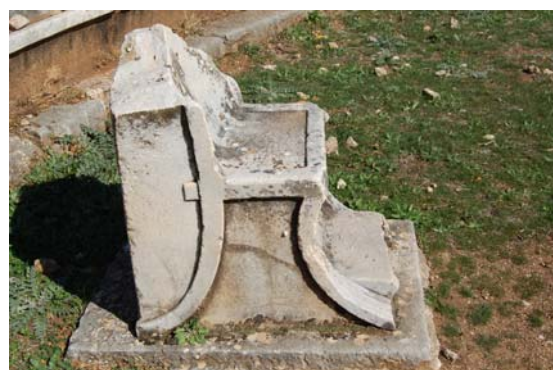
Πλάγια όψη του ίδιου θρόνου. Χαρακτηριστική η ανάγλυφη διακόσμηση, απομίμηση στοιχείων από έπιπλα.