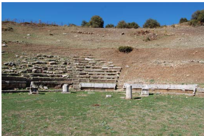
Άποψη του κεντρικού τμήματος του κοίλου.

του θα ήταν χαραγμένο σε ένα από τα μη σωζόμενα έδρανα), γιου του Επιγένους, ο οποίος είχε διατελέσει αγωνοθέτης, δηλαδή υπεύθυνος αξιωματούχος για την διοργάνωση και διεξαγωγή δραματικών αγώνων προς τιμήν του θεού Διόνυσου.