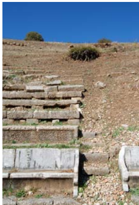
Λεπτομέρεια από την κεντρική κερκίδα του Θεάτρου.

Τα υπόλοιπα εδώλια του κοίλου είναι απλούστερης κατασκευής. Τις έδρες αποτελούν ασβεστολιθικές πλάκες, των οποίων οι άκρες εδράζονται σε αντίστοιχες μικρότερου μεγέθους. Ο τύπος αυτός θεωρείται απομίμηση ξύλινου πρότυπου ενώ κατά πάσα πιθανότητα στη χρήση του οδήγησαν λόγοι οικονομίας υλικού και χρημάτων.