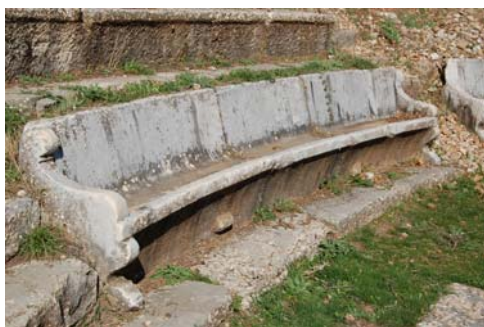
Ένα από τα καθίσματα της προεδρίας.

του θα ήταν χαραγμένο σε ένα από τα μη σωζόμενα έδρανα), γιου του Επιγένους, ο οποίος είχε διατελέσει αγωνοθέτης, δηλαδή υπεύθυνος αξιωματούχος για την διοργάνωση και διεξαγωγή δραματικών αγώνων προς τιμήν του θεού Διόνυσου.