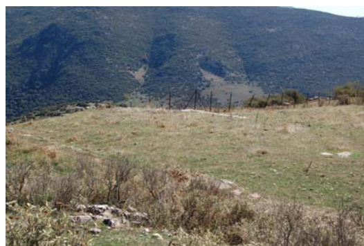
Άποψη Βόρειας Στοάς.