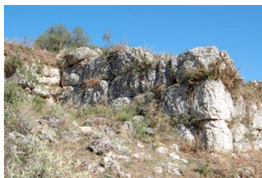
Τμήμα πύλης του τείχους.