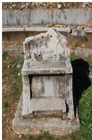
Ο ένας από τους δύο μαρμάρινους θρόνους. Εμφανείς είναι οι οπές στην πλάτη.

Πιο κοντά στο κέντρο της ορχήστρας σώζεται τμήμα αράβδωτου κίονα χωρίς βάση. Δεν είναι γνωστή η λειτουργία του αλλά ούτε και αν αυτή είναι η αρχική του θέση.