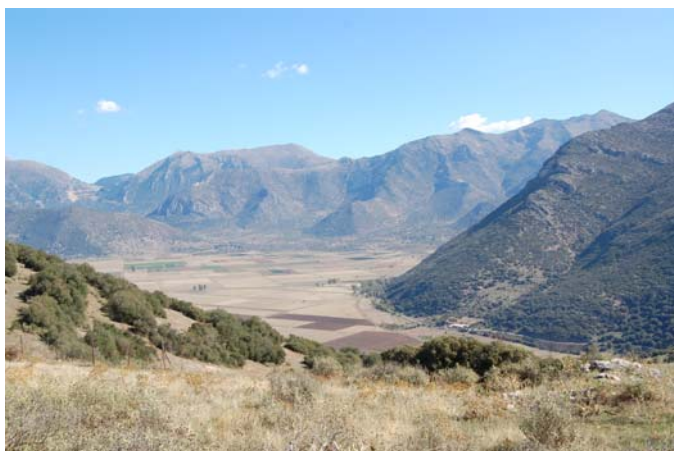
Θέα από το Θέατρο προς το δεύτερο ορχομένιο πεδίο.

Ο αρκαδικός Ορχομενός αποτελεί ένα χαρακτηριστικό παράδειγμα αρχαίας πόλης που συνδυάζει τα αμυντικά πλεονεκτήματα μίας ακρόπολης με τις δυνατότητες για επικοινωνία και ανάπτυξη της γεωργίας που προσφέρουν οι πεδινές εκτάσεις με τα ποτάμια.