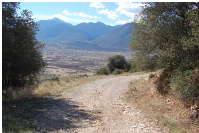
Ο δρόμος πρόσβασης στον αρχαιολογικό χώρο.

Η άγρια βλάστηση αποκρύβει συνήθως τη συνολική εικόνα των μνημείων. Απαιτείται η σε ετήσια βάση αποψίλωση των μνημείων και απομάκρυνση της ξυλώδους βλάστησης. Η πυκνή βλάστηση επίσης αυξάνει τον κίνδυνο πυρκαγιάς δεδομένου ότι στον αρχαιολογικό χώρο απουσιάζουν πλήρως μέτρα πυροπροστασίας. Εξάλλου το γεγονός ότι η βλάστηση αναπτύσσεται συχνά ανάμεσα στο οικοδομικό υλικό των μνημείων έχει επιβαρύνει την ευστάθειά τους.