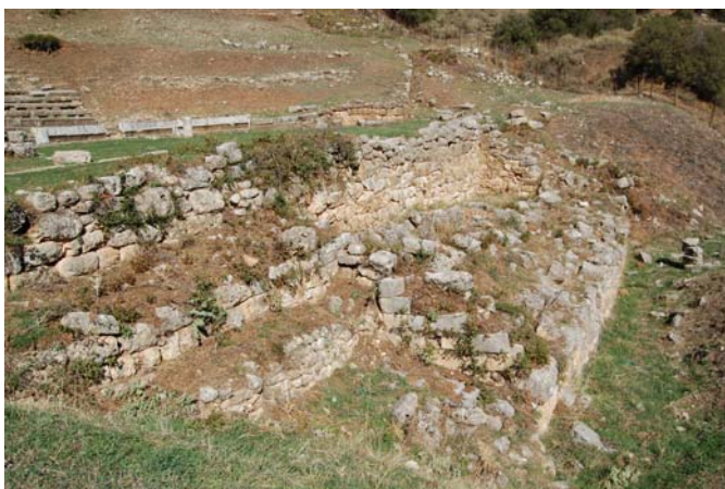
Το διάσπαρτο οικοδομικό υλικό στο χώρο της σκηνής επηρεάζει κατά πολύ την αναγωσιμότητα του μνημείου.

Εδώλια από το κοίλο του Θεάτρου έχουν πρόχειρα παρατοποθετηθεί, προφανώς για την κάλυψη αναγκών υποδοχής των θεατών σε παραστάσεις των προηγούμενων δεκαετιών.