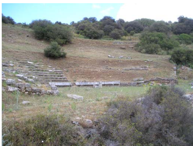
Το πρόβλημα της βλάστησης είναι έντονο σε όλη την έκταση του αρχαιολογικού χώρου. Άποψη του Θεάτρου πριν τους ετήσιους καθαρισμούς. Στο κάτω μέρος της φωτογραφίας μόλις που διακρίνεται ο αναλημματικός τοίχος της σκηνής.