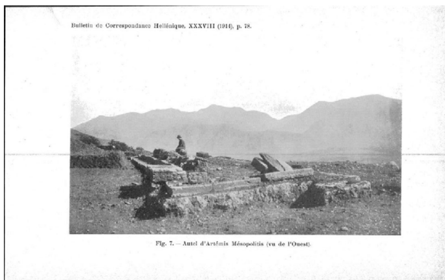
Άποψη από τα δυτικά του βωμού της Άρτεμης Μεσοπολίτιδας

Χάρη στη λεπτομερή περιγραφή του Πausανία, τον αρχαιολογικό χώρο του Ορχομενού επισκέφθηκαν και περιέγραψαν περιηγητές του 19 ου αιώνα, όπως ο Dodwell και ο Leake. Λεπτομερή αναφορά στον οχυρωματικό περίβολο της αρχαίας πόλης πραγματοποιεί στις αρχές του 20 ου αιώνα ο Hiller von Gaertringen. Οι πρώτες και σχεδόν αποκλειστικά μοναδικές ανασκαφές στην Άνω και Κάτω Πόλη διεξήχθησαν το 1913 από τους G. Blum και A. Plassart, οι οποίοι τον επόμενο χρόνο δημοσίευσαν τα αποτελέσματα της έρευνάς τους στο άρθρο με τίτλο: “Orchomène d’ Arcadie. Fouilles de 1913. Topographie, architecture, sculpture, menus objects”, BCH 1914, σελ. 71-88, πίν. III – V.