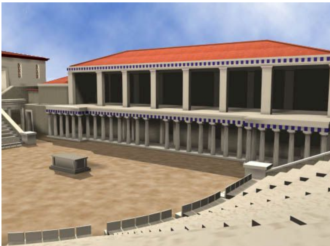
Εικ. 2 Αναπαράσταση του θεάτρου του Διονύσου. Ελληνιστικοί χρόνοι.jpg