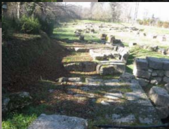
Άποψη ορχήστρας και σκηνικού οικοδομήματος