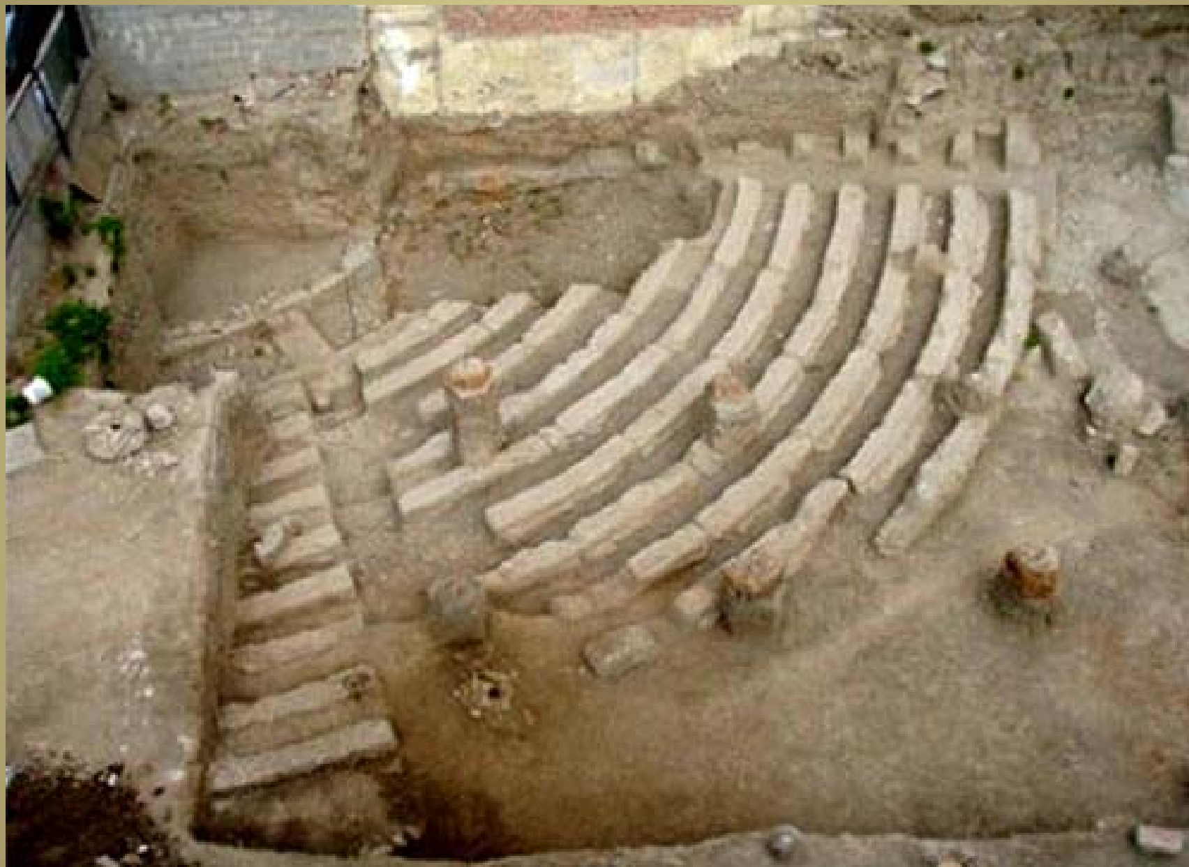
Άποψη του ανασκαμμένου θεάτρου των Αχαρνών από νότια.