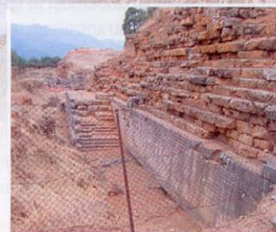
ΠΑΝΟ: Οι πρώτες εργασίες που προγραμματίζονται να γίνουν από το Υπουργείο Πολιτισμού και Αθλητισμού είναι η αποκατάσταση των αναλημματικών τοίχων του θεάτρου, με προϋπολογιζόμενη δαπάνη 5 εκατ. ευρώ.

Αξίζει, επιπλέον, να σημειωθεί ότι με την τεκμηρίωση του