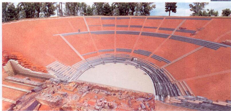
ΠΑΝΩ: Η πρόταση αποκατάστασης του αρχαίου θεάτρου της Σπάρτης σε φωτορεαλιστική απεικόνιση.

φωση των δυο ακριανών πτερύγων έχουν κατασκευαστεί τεράστιοι αναλημματικοί τοίχοι πάχους έως και 5,5μ., οι οποίοι αποτελούν σπουδαίο τεχνικό επίτευγμα.