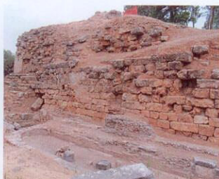
ΠΑΝΟ: Άποψη των αναλημματικών τοίχων του θεάτρου στη σημερινή τους κατάσταση.

Το αρχαίο θέατρο της Σπάρτης είναι το μεγαλύτερο στον ελληνικό χώρο, με διάμετρο κοίλου 141 μέτρα, με ένα επιθέατρο και πρόβληψη για δεύτερο, συνολικής δυναμικής 17.000 θεατών, και με αναλημματικά τείχη πάχους 5,5 μέτρων.