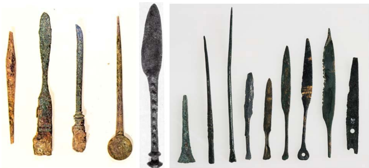
Φωτ. 5: Δείγματα ιατρικών εργαλείων από την Επίδαυρο.