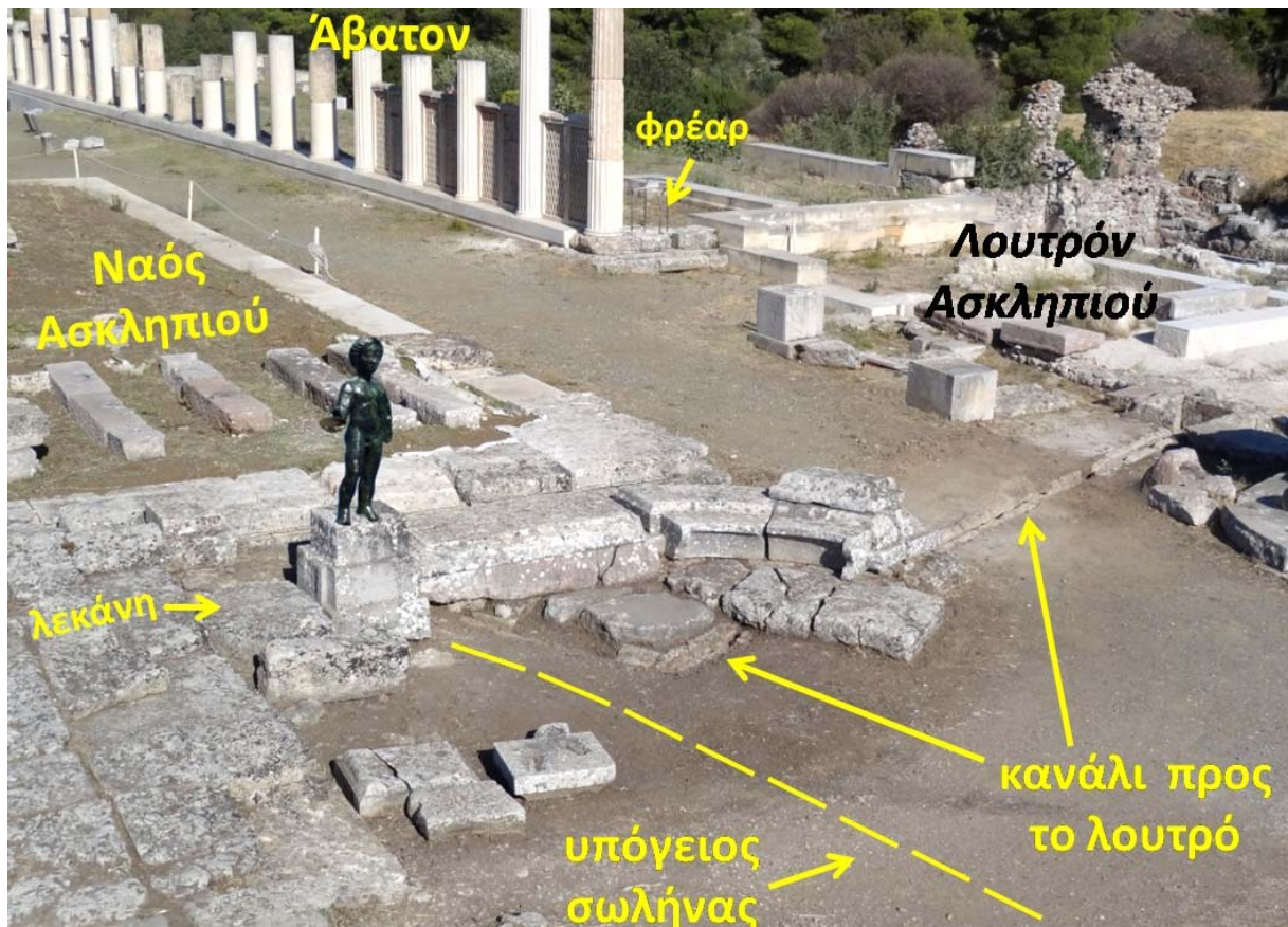
Φωτ. 2: Παράδειγμα μνημείου που δείχνει την καθαρκτική χρήση του νερού. Μέσα από το σώμα του θεού ρέει το νερό μέσα στο οποίο καθαίρονταν πριν από την εγκοίμηση στο «Λουτρόν Ασκληπιού» οι ασθενείς.