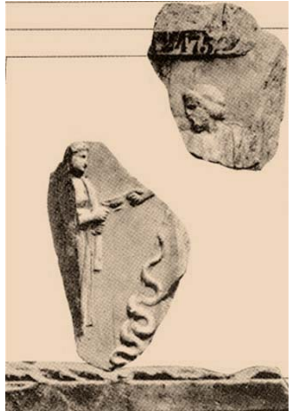
Φωτ. 4: Σκηνή εγκοίμησης. Ο Ασκληπιός δίνει φάρμακο στον ασθενή μέσα στο όνειρό του.