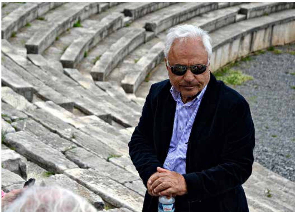
Ο καθηγητής αρχαιολογίας Πέτρος Θέμελης. Ένας εμπνευσμένος επιστήμων, ένας οραματολάτης στοχαστής που από το 1986 μέχρι σήμερα δεν έχει πάψει ούτε στιγμή να ασχολείται με την αποκάλυψη και την ανάδειξη της αρχαίας Μεσσήνης.

διασκέδαση αλλά και το μέγεθος και τη σπουδαιότητα της πόλης τους και κυρίως το ρόλο που αυτή κλήθηκε να παίξει στην περιοχή και τον συνέχισε και σε όλη την πορεία της ζωής της. Δημιουργήθηκε για να γίνει το αντίπαλον δέος της κραταιάς Σπάρτης. Το ίδιο και η Μεγαλόπολη, βέβαια, στην Αρκαδία.