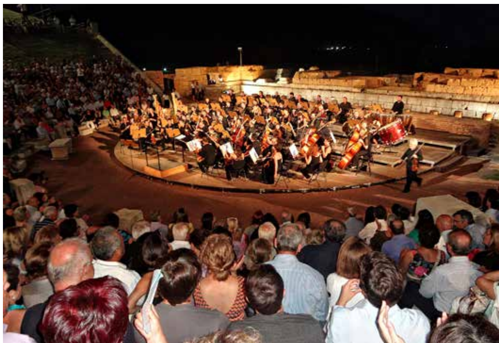
Μετά από 1700 χρόνια σιωπής το αρχαίο θέατρο γέμισε πάλι με «μουσικές εξαισίες και φωνές» Τα θυρανοί- ξια του γιορτάστηκαν στις 3 Αυγούστου 2013 με μια λαμπρή μουσική εκδήλωση

χρόνια της λειτουργίας του θεάτρου - με λεοντοπόδαρα και χωριστά δουλεμένο υποπόδιο προκαλούν το σημερινό επισκέπτη να καθίσει και να αισθανθεί άρχοντας ή επίσημα προσκεκλημένος. Το ερείσινωτο, δηλαδή η πλάτη του ενός θρόνου, αυτού που βρίσκεται στην κορυφή της ορχήστρας, απολήγει σε κεφάλι χήνας. Γίνεται αμέσως αντιληπτό πως προοριζόταν για υψηλά ιστάμενο πρόσωπο, ενδεχομένως για τον ιερέα του θεού Διονύσου ή για τον αγωνοθέτη της εορτής των Διονυσίων. Τόσα χρήματα δαπανούσε ο αγωνοθέτης για τα γεύματα προς όλους τους δημότες («δημοθοινίες» ονομάζονταν τα γεύματα αυτά), το λιγότερο με το οποίο η πολιτεία τον αντάμειβε ήταν μια θέση περιωπής. Για την αντιμετώπιση των καιρικών φαινομένων, όπως ήταν μια δυνατή βροχή, βρέθηκε λύση, ώστε να μην πλημμυρίζει η ορχήστρα. Δημιουργήθηκε ένα αulάκι απορροής των ομβρίων υδάτων, το οποίο περιτρέχει την ορχήστρα και τα