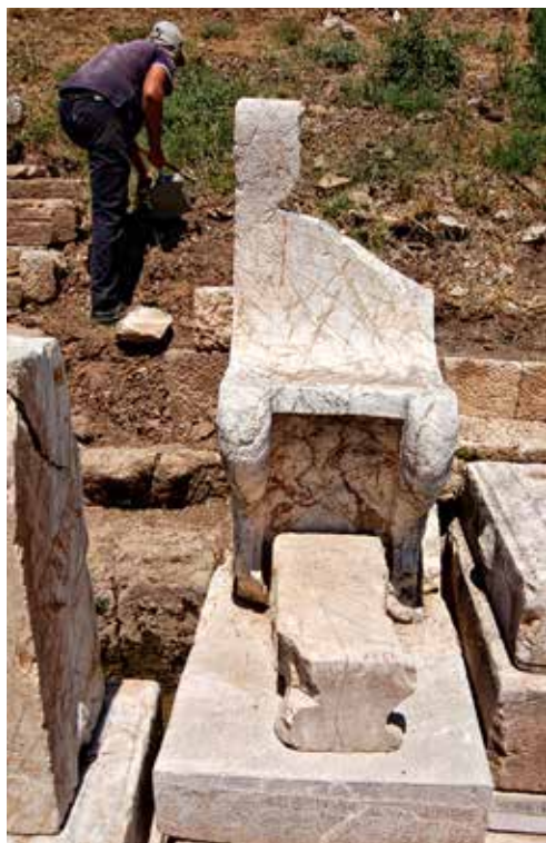
Δεξιά: Λίθινος θρόνος στην κορυφή του ημικυκλίου της ορχήστρας του θεάτρου.

ράμπα οδηγούσε στο μεσαίο διάζωμα του κοίλου, μια ακόμα αρχιτεκτονική πρωτοτυπία σε αυτό το θέατρο, που ήταν όλο εκπλήξεις για τον αδαή.