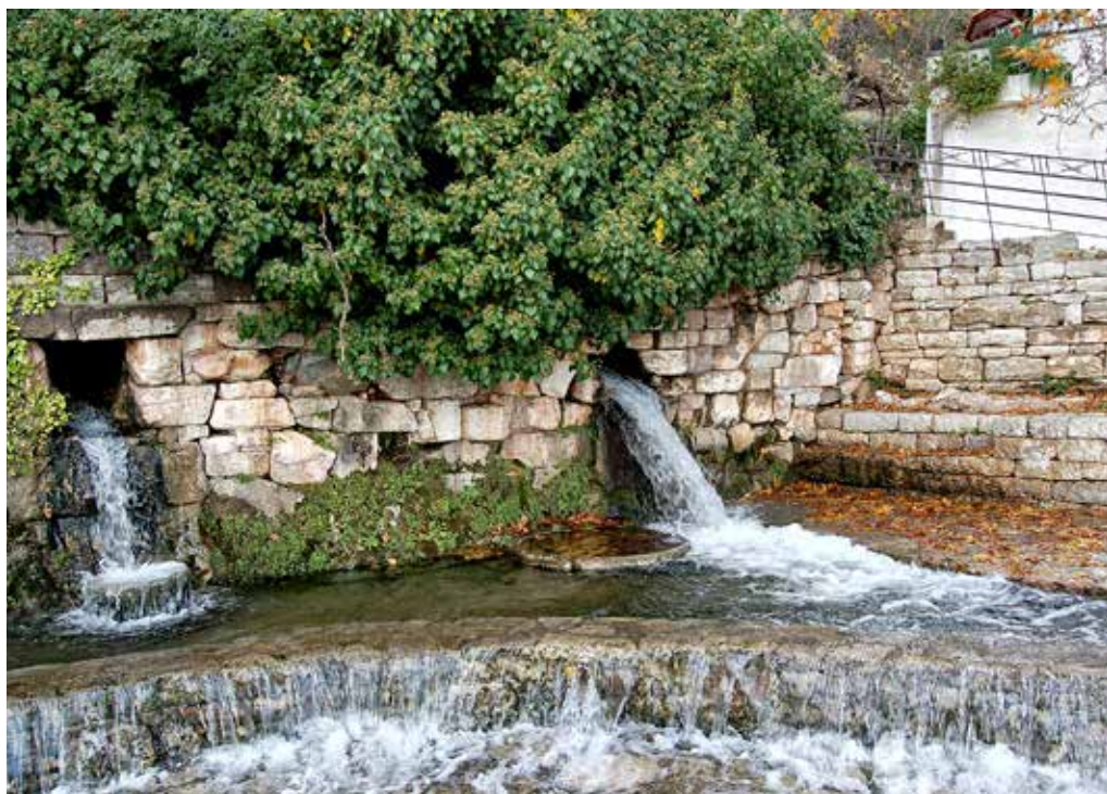
Η πηγή Κλεψύδρα μέσα στο χωριό Μαυρομμάτι, δίπλα στο υστεροβυζαντινό εκκλησάκι του Άη Γιάννη του Ριγανά. Ταυτίζεται με την αρχαία Κρήνη Κλεψύδρα από το νερό της οποίας γέμιζε η Κρήνη Αρσινόη.

γιου, του Ασκληπιού. Το περίεργο είναι πως στην περιοχή της Επιδαύρου μπέρα του Ασκληπιού θεωρείται η Κορωνίς. Για να μην μπουν σε περιπέτειες οι αρχαίοι Έλληνες βρήκαν τη λύση: η μία τον γέννησε και η άλλη τον μεγάλωσε είπαν, κι έτσι κανείς δεν ενοχλήθηκε.