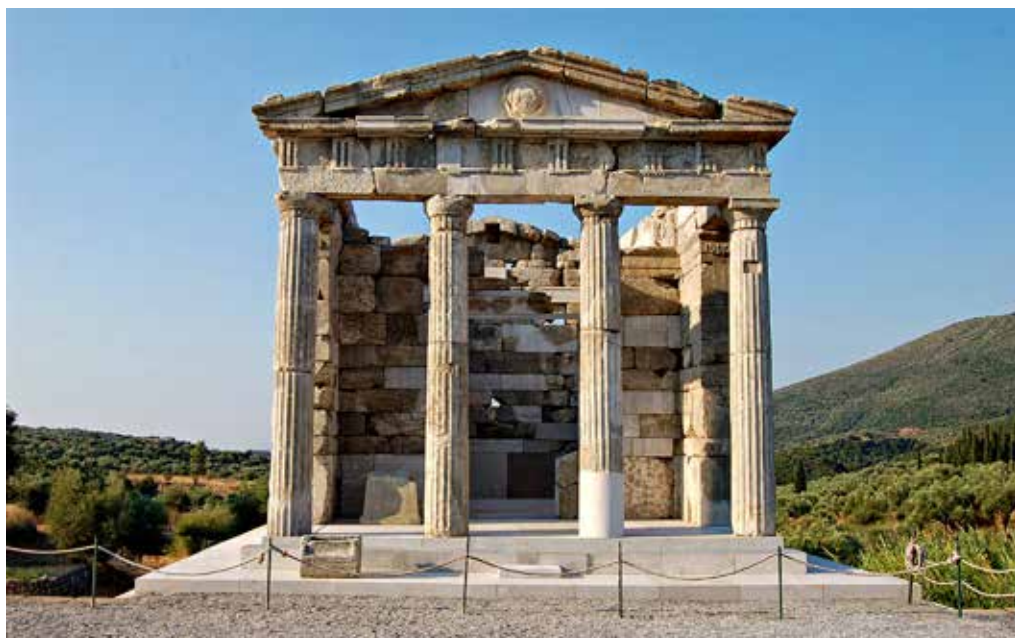
Το Μουσολείο των Σαιθιδών δεσπόζει στο τέρμα του Σταδίου. Χρησιμοποιήθηκε για τον ενταφιασμό των μελών της επιφανούς οικογενείας από τον 1ο έως τον 3ο αι. μ.Χ.

Καρνείου Απόλλωνα και ορισμένων γυναικείων θεοτήτων της γονιμότητας και της ευκαρπίας της γης και ένιωσε τόσο ευτυχισμένη που έκανε πολλά καλά στον τόπο, γι' αυτό και οι Μεσσήνιοι την τιμούσαν σαν ηρώίδα στον ναό που προαναφέραμε. Γύρω από το ναό υπήρχε αυλή που περιβαλλόταν από στοά ανοικτή προς το μέρος του ναού. Η στοά αποτελείτο από δύο σειρές κιόνων κορινθιακού ρυθμού. Εξαιρετική δουλειά είχε γίνει στα κιονόκρανα που ήταν καταστόλιστα με έλικες και άκανθες απ' όπου ξεπρόβαλλαν Νίκες και Ερωτιδείς. Λαμπρά στολισμένη με βουκράνια, γιρλάντες με άνθη και φιάλες ήταν και η ζωφόρος, που ήταν στημένη πάνω από το ιωνικό επιστύλιο με τις τρεις ζώνες. Ακριβώς πάνω από τη ζωφόρο υπήρχε ένα οδοντωτό γείσο και πάνω από αυτό μια σειρά με έλικες και λεοντοκεφαλές που λειτουργούσαν ως υδρορροές.