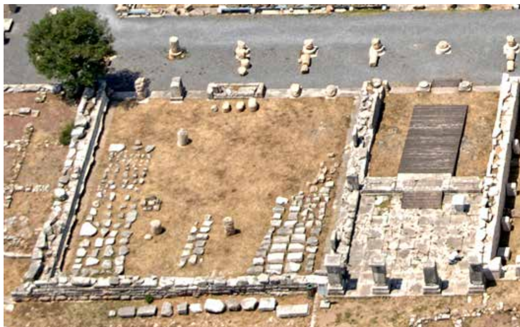
Το Βουλευτήριο αποτελούσε τον χώρο των πολιτικών συνελεύσεων των αντιπροσώπων των πόλεων της αυτόνομης και ομόσπονδης Μεσσηνίας.