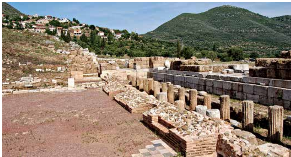
Το σκηνικό οικοδόμημα του 2ου αι. μ.Χ. Οι κάτω κόγχες. Στο βάθος το χωριό Μαυρομμάτι. Οι κάτοικοί του είναι οι θεματοφύλακες αυτής της σπουδαίας πολιτιστικής κληρονομιάς.