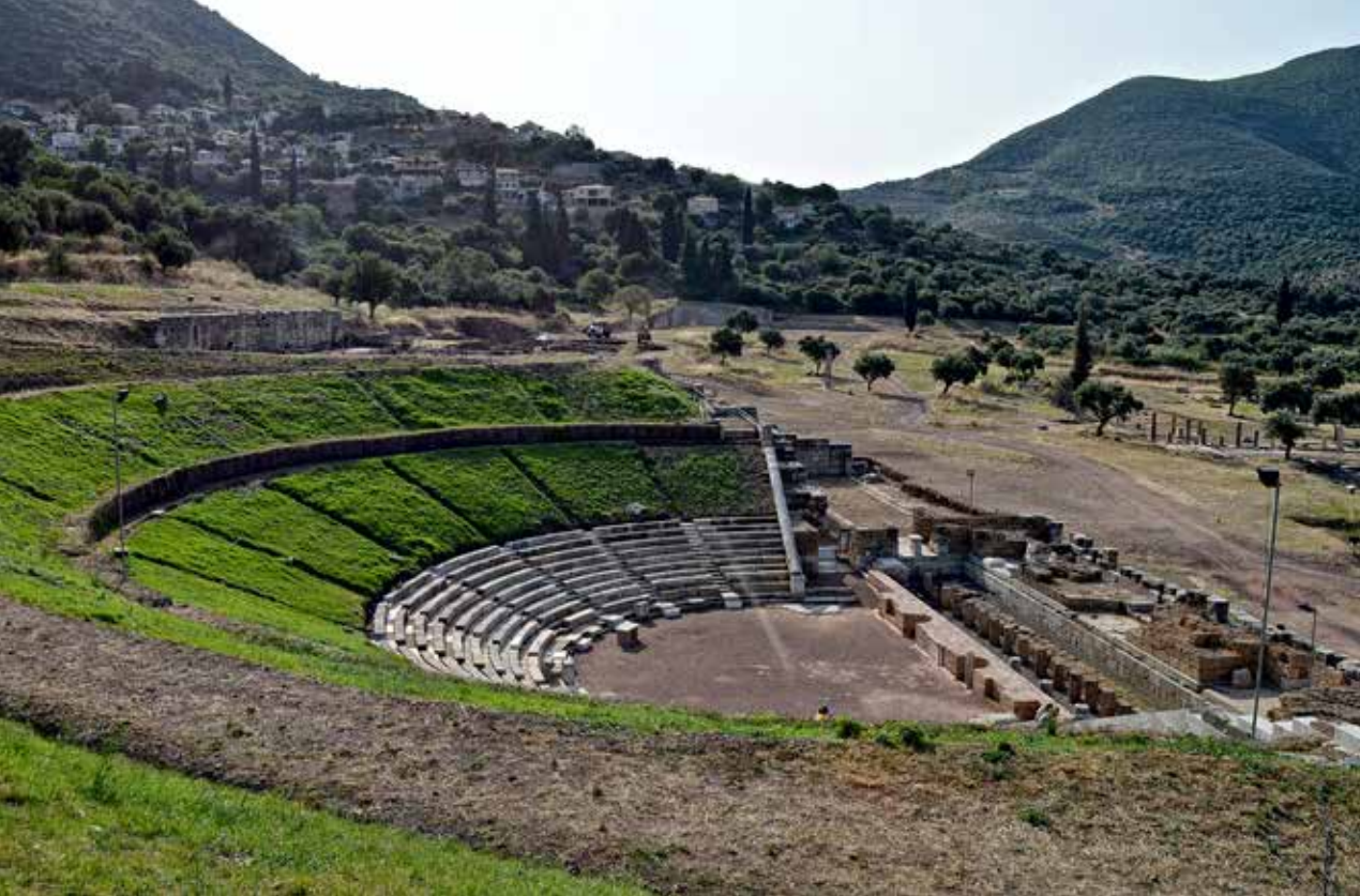
Το κοίλον, η ορχήστρα και η σκηνή: τα τρία βασικά αρχιτεκτονικά μέρη του περίφημου θεάτρου της αρχαίας Μεσσήνης που ξεχώριζε χάρη στις τολμηρές ιδιομορφίες του.

με τη στιβαρότητά του το οικοδόμημα αυτό, πριν ακόμα καλά καλά ο θεατής εισέλθει για να καθίσει στο κοίλον με τα λίθινα εδώλια που δεν είναι μονολιθικά, αλλά σύνθετα, δηλαδή αποτελούνται όχι από μία αλλά από πολλές και διαφορετικού μεγέθους πλάκες. Ορισμένα εδώλια φέρουν και επιγραφές, πολύ σημαντικές μάλιστα για την οικονομική ή την κοινωνική κατάσταση των πολιτών. Θα μπορούσαμε, επομένως, να πούμε πως οι πλάκες των εδωλίων και μάλιστα αυτές των μετώπων λειτουργούσαν και ως λίθινοι πίνακες ανακοινώσεων, οι οποίες με αυτό τον τρόπο αποκτούσαν ισχύ. Για παράδειγμα, σε κάποιες επιγραφές γίνεται λόγος για απελευθερώσεις σκλάβων, που ενδεχομένως να σχετίζονταν με τα καλλιτεχνικά δρώμενα.