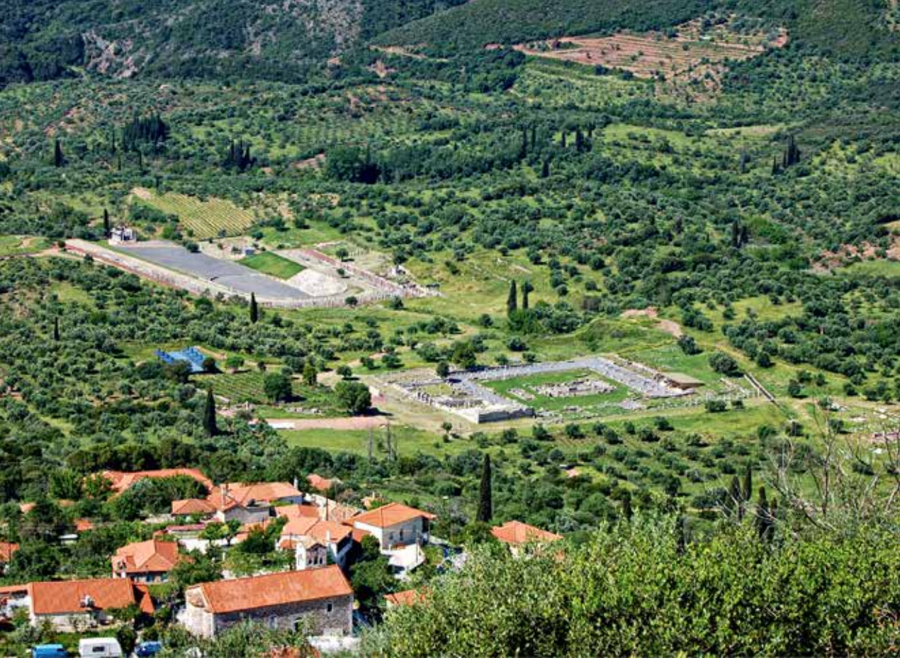
Αρχαία πόλη και σύγχρονο χωριό. Αρμονικό συνταίριασμα μέσα στην καταπράσινη αγκαλιά της μεσσηνιακής γης.

Το μέλλον προοιωνιζόταν λαμπρό ακόμα και τη στιγμή της σύλληψης της ιδέας για τη δημιουργία αυτής της πόλης, που βρίσκεται στο κέντρο περίπου του σημερινού νομού Μεσσηνίας. Γιατί αυτός, στο μυαλό του οποίου έγιναν οι διεργασίες που οδήγησαν στη σκέψη της ίδρυσης της Μεσσήνης το 369 π.Χ. , δεν ήταν μόνο ένας άνδρας τολμηρός σε αποφάσεις και κινήσεις αλλά κι ένας μεγαλοφυής στρατηγός κι ένας βαθύτατα καλλιεργημένος Έλληνας με πολιτική σκέψη. Ο Επαμεινώνδας , ο εμπνευστής και ποιητής της θηβαϊκής ηγεμονίας, ο άνθρωπος που ανέβασε τη Θήβα στον κορυφώνα της δόξας και ταυτόχρονα κατέβασε τη Σπάρτη από το βάθρο της πρώτης, για αιώνες, στρατιωτικά δύναμης στην Ελλάδα, δεν σταμάτησε στη νικηφόρα γι' αυτόν μάχη στα Λεύκτρα (371 π.Χ.) . Συνέχισε με την