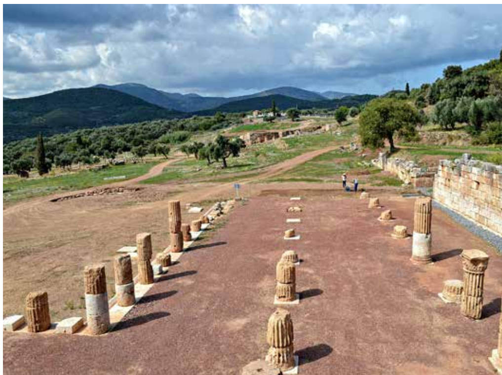
Η βόρεια στοά της Αγοράς.

Όταν μπήκε στην πόλη, είδε πρώτη την Αγορά. Είδε την Κρήνη Αρσινόη στην οποία έρρεε το νερό από την πηγή Κλεψύδρα, τους ναούς και τα λατρευτικά αγάλματα του Διός Σωτήρος και του Ποσειδώνος, τους ναούς και τα αγάλματα της Αφροδίτης, της Μητρός των Θεών Κυβέλης, της Δήμητρας και των Διοσκούρων. Στη συνέχεια είδε τα ιερά της θεάς του τοκετού Ειλειθυίας και τον θάλαμο των Κουρητών, των οπλισμένων δαιμόνων που φύλαγαν τον Δία βρέφος. Συνεχίζοντας προς νότον είδε το Ασκληπιείο, ενώ νοτιότερα είδε το Ιεροθύσιο με τα αγάλματα των δώδεκα θεών και τον χάλκινο ανδριάντα του ισόθεου ήρωα, οικιστή της πόλης Επαμεινώνδα. Σειρά είχαν το Στάδιο και το Γυμνάσιο με τα ιερά και τα αγάλματα του Ηρακλή, του Ερμή και του Θησέα, έργα των Αλεξανδρινών καλλιτεχνών Απολλώνιου Ερμοδώρου και του