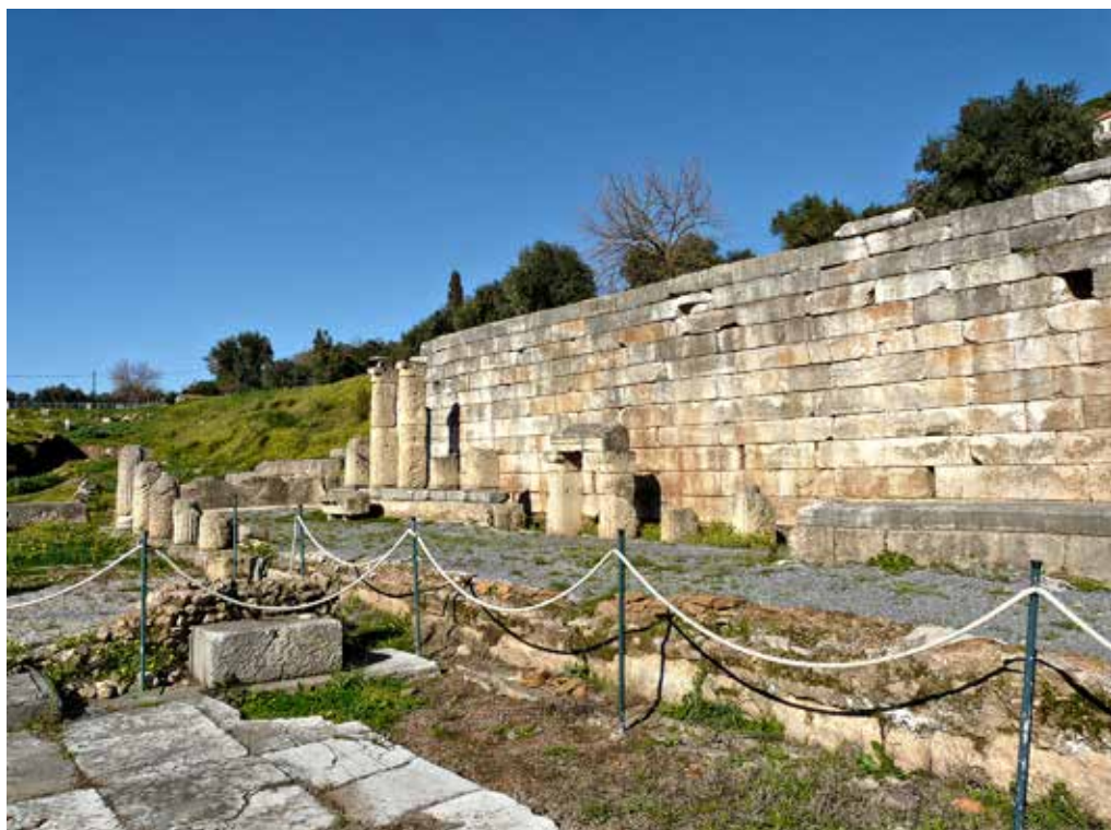
Η Κρήνη Αρσινόη. Η κατασκευή του μνημειώδους κρηναίου οικοδομήματος ανάγεται στα τέλη του 3ου αι. π.Χ. ενώ μετατροπές και επισκευές πραγματοποιήθηκαν κατά τον 1ο και 3ο αι. μ.Χ.

Στάδιο, αναφορά στο οποίο κάνει μόνο για να πει, πως υπήρχε εκεί χάλκινος ανδριάντας του μεσσήνιου ήρωα Αριστομένη. Ενδεχομένως, να έπεσε πάνω στη φάση των μετατροπών που έγιναν σε αυτά τα δύο πολύ σπουδαία οικοδομήματα, τα οποία, σήμερα, με τις αναστηλώσεις και τις αποκαταστάσεις τους, καταδεικνύουν το πόσο εντυπωσιακά ήταν και πόσο ανάλογα του μεγαλείου της πόλης στην οποία δημιουργήθηκαν.