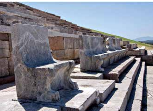
Επάνω: Ο λίθινος θρόνος και το έδρανο της προεδρίας στην εξέδρα των επισήμων στο Στάδιο.