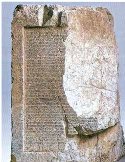
Το ενεπίγραφο βάθρο για το άγαλμα του ευεργέτη της πόλης Τιβέριου Κλαύδιου Σαιθίδα Καίλιανου.

Το άρθρο αυτό αφιερώνεται σε δύο πολύ σπουδαίους άνδρες, τον πρόεδρο του «Διαζώματος» κ. Σταύρο Μπένο και τον καθηγητή Αρχαιολογίας κ. Πέτρο Θέμελη που χάρισαν σε μένα και την