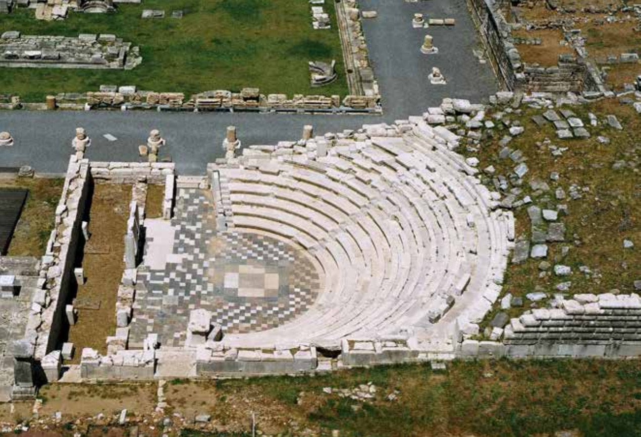
Το κομψό Εκκλησιαστήριο. Ένα ακόμη θεατρικό οικοδόμημα στα δεξιά του προπύλου που οδηγούσε στο Ασκληπιείο.

και διακοσίων εύπορων πολιτών το 214 π.Χ. Η κατάληψη της πόλης από το Μακεδόνα βασιλιά αποφεύχθηκε χάρη στο εξαιρετικό ταλέντο του Άρατου να υπερισχύει του συνομιλητή του με την πειθώ, ωστόσο ο ίδιος και μαζί και ο γιος του πλήρωσαν ακριβά τις πολιτικές και στρατιωτικές αρετές του, που έβαζαν φραγμό στα σχέδια του Φιλίππου να κυριαρχήσει απόλυτα στην Πελοπόννησο, καθώς ο τελευταίος δε δίστασε να τους δηλητηριάσει για να απαλλαγεί (Άρατος 50.1-3). Στο χώρο του θεάτρου, 31 χρόνια αργότερα, συγκεντρώθηκαν οι κάτοικοι της μεσσηνιακής πρωτεύουσας, για να δουν και να χλευάσουν τον περίφημο στρατηγό της Αχαϊκής Συμπολιτείας, Φιλοποίμενα τον Μεγαλοπολίτη, τον γνωστό και ως «τελευταίο Έλληνα», που εξετέθη σε κοινή θέα μετά την ατυχή αιχμαλωσία του από τους Μεσσήνιους, με τους οποίους λίγο πριν είχε συγκρουσθεί και τους είχε νικήσει.