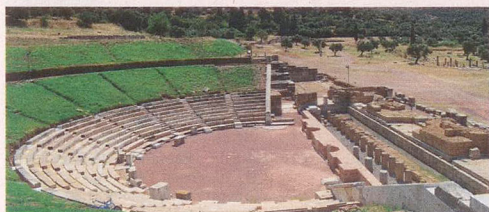
Το αρχαίο θέατρο της Μεσσήνης

■ INFO: «Πέτρος Θέμελης: Αγγίξα... Αγάπησα... Εσκάψα» Κυριακή 24 Νοεμβρίου στις 11.30 OPERA ODEON, Ακαδημίας 57