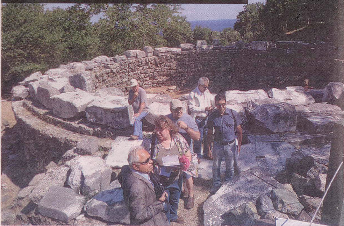
Το κλιμάκιο του «Διαζώματος» μπροστά στο Αρσινόειο.

Ήταν μια περιοδεία εργασίας που διέτρεξε όλο το τόξο της βορείου Ελλάδας. Ξεκίνησε από την αρχαία Μίεζα, στη Σχολή του Αριστοτέλη, κοντά στη Νάουσα και κατέληξε στη Σαμοθράκη. Σκοπός της περιοδείας ήταν να διερευνήσουμε μαζί με τις κατά τόπους Εφορίες Αρχαιοτήτων, που έχουν τον πρώτο λόγο, τα προβλήματα που προκύπτουν, όπως το κάνουμε εδώ και πολλά χρόνια με μεγάλη επιμέλεια. Αυτό το ταξίδι είχε και μια ιδιαιτερότητα, διότι στο κλιμάκιο συμμετείχαν δυο κορυφαίοι καθηγητές, της αρ-