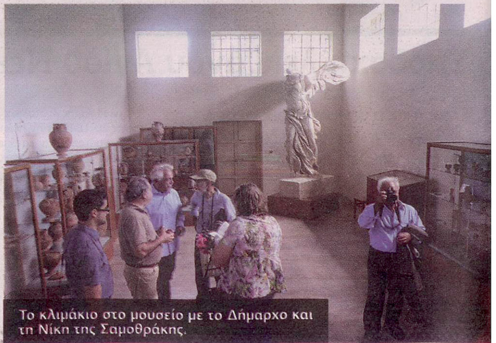
Το κλιμάκιο στο μουσείο με το Δήμαρχο και τη Νίκη της Σαμοθράκης.