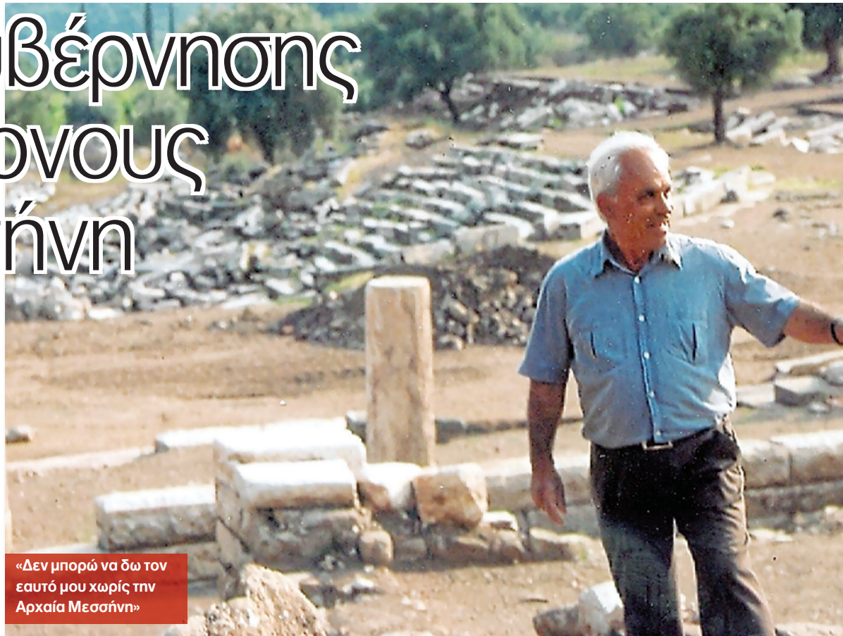
«Δεν μπορώ να δω τον εαυτό μου χωρίς την Αρχαία Μεσσήνη»

Απόψε, ύστερα από 2.300 χρόνια σιωπής, το Αρχαίο θέατρο Μεσσήνης επιστρέφει στη ζωή χάρις τους πόρους του ΚΠΣ και τη γενναία χορηγία του Ιδρύματος Σταύρος Νιάρχος