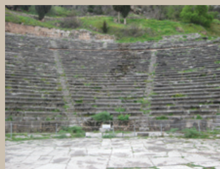
Εικ. 3: Το κοίλον του αρχαίου θεάτρου των Δελφών

4 Περισσότερες πληροφορίες για τη χρηματοδότηση κάθε μνημείου περιλαμβάνονται στην ηλεκτρονική διεύθυνση: http://www.diazoma.gr/GR/Page_05-01.asp , τελευταία επίσκεψη: 01-03-2012. ■