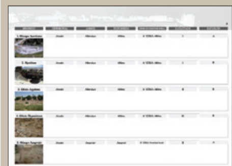
Εικ. 2: Η πρώτη σελίδα του Πανοράματος των αρχαίων χώρων θέασης και ακρόασης