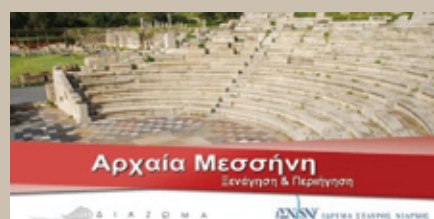
Εικ. 6: Εφαρμογή ξενάγησης για «έξυπνες» κινητές συσκευές