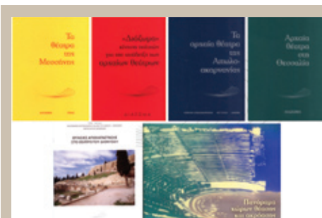
Εικ. 1: Οι εκδόσεις του «ΔΙΑΖΩΜΑΤΟΣ»

3. στους πολίτες, οι οποίοι μπορούν να συνει-