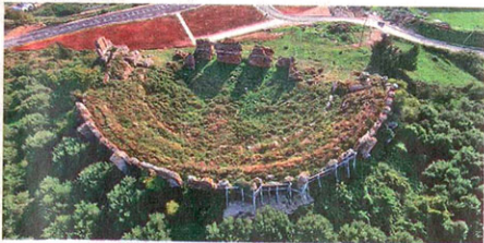
Το μεγάλο ρωμαϊκό θέατρο της Νικόπολης θυμίζει αυτό της Πομπηίας.