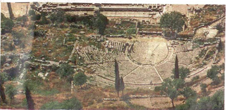
Το θέατρο των Δελφών βρίσκεται εντός του ιερού του Πυθίου Απόλλωνος.