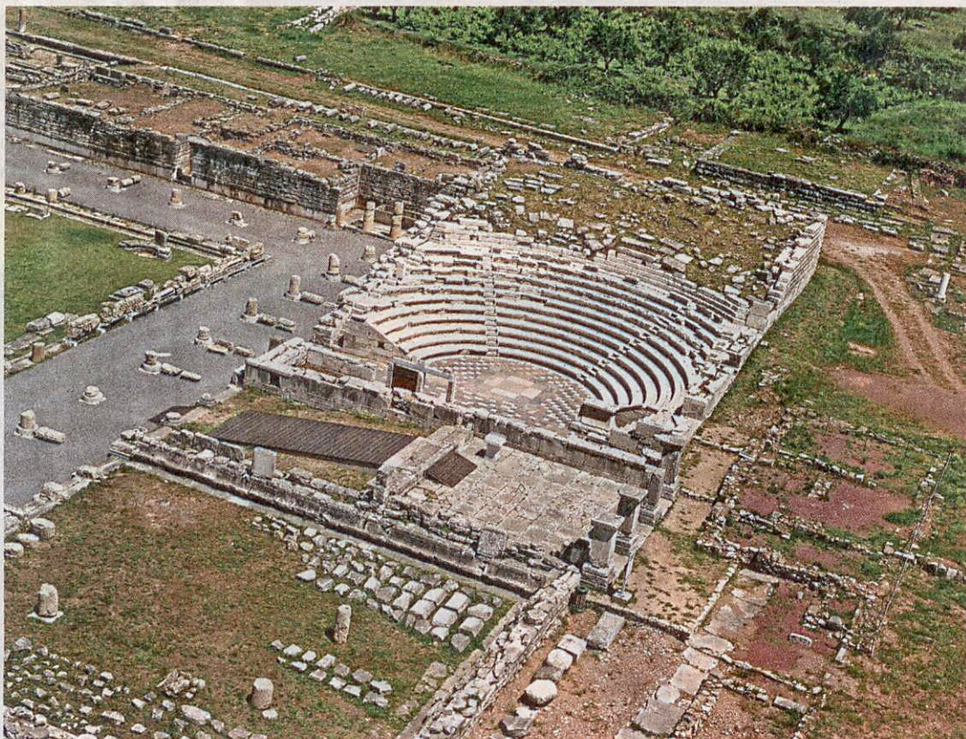
Το αποκατεστημένο Εκκλησιαστήριο (Ωδείο) της Αρχαίας Μεσσήνης βρίσκεται κοντά στο χωριό Μαυρομάτι της Μεσσηνίας.

Η επιτυχία, το γεγονός ότι την προσπάθεια αγκάλιασαν, δηλαδή εμπιστεύτηκαν όλοι οι δυνητικά εμπλεκόμενοι με την αποκατάσταση των εν λόγω μνημείων, είναι απόρροια τριών διαφορετικών παραγόντων: του μη κερδοσκοπικού χαρακτήρα του σωματείου και των ξεκάθαρων οικονομικών του, του σεβασμού της ιδιοπροσωπίας και της ιερότητας των μνημείων που έκαμψε τη δικαιολογημένη από την εμπειρία έντονη δυσπιστία των αρχαιολόγων και