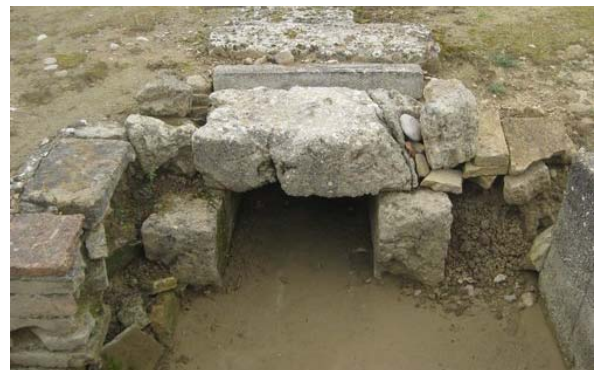
Σε λεπτομέρεια αγωγός του θεάτρου

Κοντά στο θέατρο αναφέρεται από τον Πανσανία η ύπαρξη ιερού του Διονύσου (6, 26, 1). Ημικυκλικό κρηπίδωμα από στεγασμένο μικρό κτίριο του τέλους του 4ου αι. π.Χ. που βρέθηκε κοντά στη δυτική πάροδο, ανήκει ίσως σε χορηγικό μνημείο. Το θέατρο διέθετε επίσης οργανωμένο αποχετευτικό σύστημα.