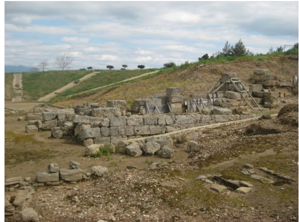
Λεπτομέρεια αναλημματικός τοίχος

Η παλαιότερη φάση κατασκευής του χρονολογείται στο α' μισό του 4ου αι. π.Χ. Ισχυροί αναλημματικοί τοίχοι συγκρατούσαν την επίχωση του κοίλου και διαμόρφωναν με τα πλευρικά διαμερίσματα της σκηνής τις δύο παρόδους του θεάτρου.