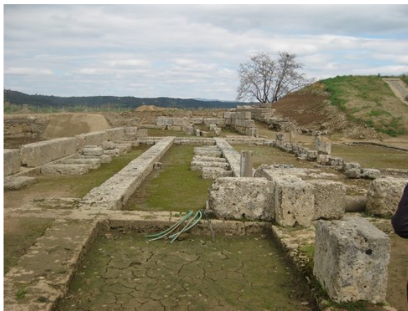
Το σκηνικό οικοδόμημα του θεάτρου