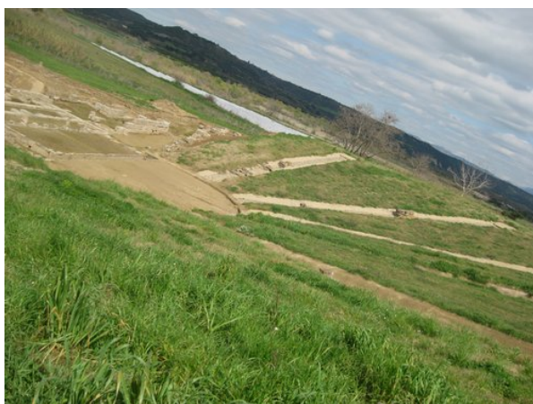
Άποψη του θεάτρου