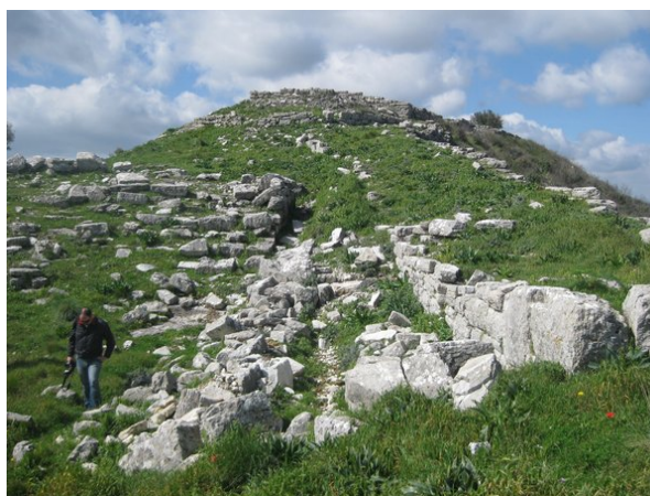
Η αρχαία άνω ακρόπολη: άποψη από μακριά

Όλοι μαζί ξεκινήσαμε για την αρχαία Πλατιάνα , μια εντυπωσιακή αρχαία πόλη, κτισμένη σε λόφο, η οποία από μακριά φαίνεται σαν να αιωρείται. Μετά από μια αρκετά κοπιαστική, αλλά και συναρπαστική ανάβαση προσεγγίσαμε τον αρχαιολογικό χώρο της αρχαίας ακρόπολης και απολαύσαμε την πανοραμική θέα.