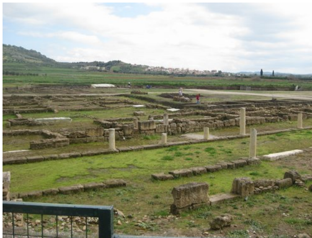
Συνολική άποψη αρχαιολογικού χώρου Ήλιδας

Το 1960 οι ανασκαφές συνεχίστηκαν από την Ελληνική Αρχαιολογική Εταιρεία υπό τη διεύθυνση του καθηγητή Ν.Γιαλούρη. Στα πλαίσια εργασιών ανάδειξης του αρχαιολογικού χώρου της Ήλιδας πραγματοποιήθηκαν αποψίλωση και καθαρισμός, δεντροφύτευση, διαδρομές περιήγησης, επεξηγηματικά κείμενα, συντήρηση (στερέωση-συμπλήρωση) των επιμέρους μνημείων.