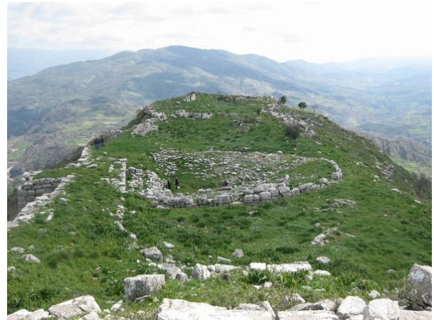
Το θέατρο μπροστά από τα τείχη της πόλης

Σήμερα διατηρείται μόνο τμήμα της σκηνής και του κοίλου, ενώ σε καλή κατάσταση διατηρείται ο αρχαίος αναλημματικός τοίχος του θεάτρου. Το θέατρο είναι κτισμένο κοντά στα τείχη της πόλης.