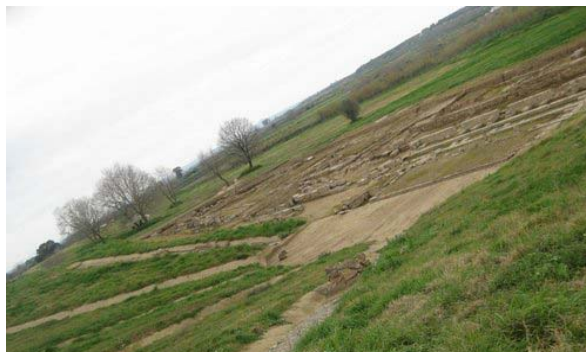
Άποψη θεάτρου σήμερα

Το θέατρο βρήκε εγκαταλειμμένο ο Περιηγητής. Έναν αιώνα αργότερα ολόκληρη η περιοχή μετατράπηκε σε νεκροταφείο. Η καταστροφή αυτή που παρατηρείται και σε άλλα σημεία της αρχαίας πόλης σχετίζεται με την επιδρομή των Ερούλων (267 μ.Χ.).