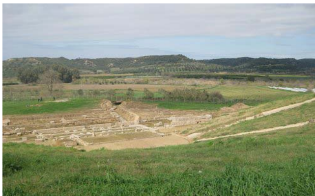
Τα αρχαία θέατρο της Ήλιδας

Το αντιπροσωπευτικότερο ίσως μνημείο είναι το θέατρο (φωτο 7040:) . Χτισμένο με κατάλληλη διαμόρφωση σε μια παλιά αναβαθμίδα του Πηνειού ποταμού, στα βόρεια της αγοράς. Για την εξυπηρέτηση των συγκοινωνιακών αναγκών υπήρχε γέφυρα και για την προστασία από τις πλημμύρες ισχυρό ανάλημμα. Κοντά στο θέατρο και κατά μήκος μιας αναβαθμίδας του Πηνειού, θα πρέπει να τοποθετηθούν βάσει των ενδείξεων το βουλευτήριο και τα δύο γυμνάσια της πόλης.