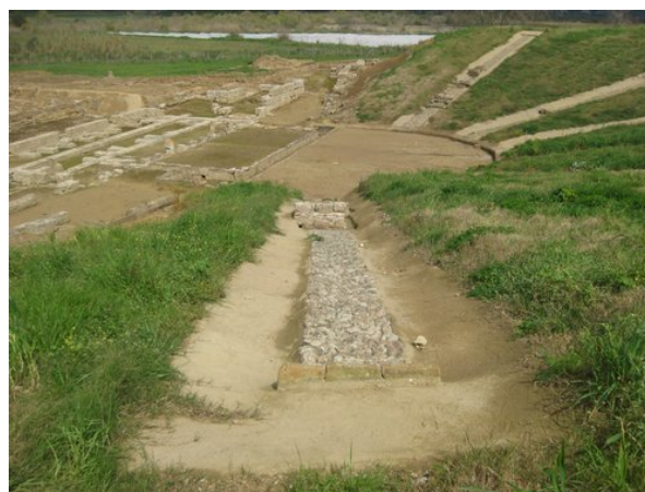
Οι κλίμακες του θεάτρου και φωτο 7069: διακρίνεται η λιθινή υποθεμελίωση μιας κλίμακας