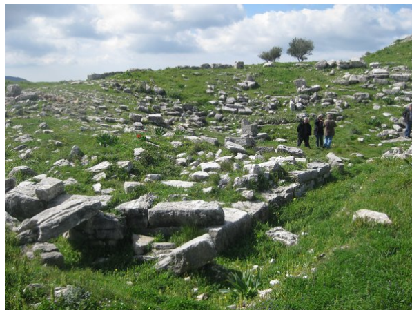
Το υλικό του θεάτρου

Το αρχαίο θέατρο της Πλατιάνας αποτελεί το δεύτερο σωζόμενο μνημείο της συγκεκριμένης κατηγορίας στο Νομό Ηλείας, μετά από αυτό της αρχαίας Ήλιδας. Το μνημείο σήμερα έχει τη μορφή ενός μεγάλου ερειπίωνα, από το οποίο σώζεται σε μορφή λιθοσωρού το αρχικό υλικό.