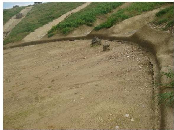
Λεπτομέρεια η κυκλική ορχήστρα

Η μόνιμη λίθινη σκηνική κατασκευή είναι από τις αρχαιότερες. Σώζει ένα από τα παλαιότερα προσκήνια (αρχές 3ου αι. π.Χ.), η πρόσοψη του οποίου ήταν διακοσμημένη με ημικίονες. Μεγάλες οπές κατά μήκος του στυλοβάτη επέτρεπαν την τοποθέτηση των σκηνικών. Πίσω από το προσκήνιο υπήρχαν τα διάφορα ευρύχωρα διαμερίσματα της σκηνής και εκατέρωθέν της, τα παρασκήνια. Η αρχικά κυκλική ορχήστρα περιορίστηκε από την κατασκευή μιας μακρόστενης δεξαμενής που διοχέτευε τα όμβρια ύδατα μέσω ενός παλαιότερου αγωγού στον Πηνειό. Η κατασκευή της συνδυάστηκε προφανώς με την εξοικονόμηση ενός ορθογώνιου χώρου εμπρός από το σκηνικό οικοδόμημα και την διευθέτηση ενός λογείου για τις ανάγκες της Νέας Κωμωδίας. Στο πίσω μέρος της σκηνής είχε αναπτυχθεί ήδη από την Ελληνιστική εποχή ένας συνοικισμός.