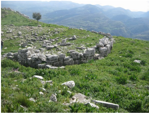
Λεπτομέρεια του θεάτρου με τον αναλημματικό τοίχο