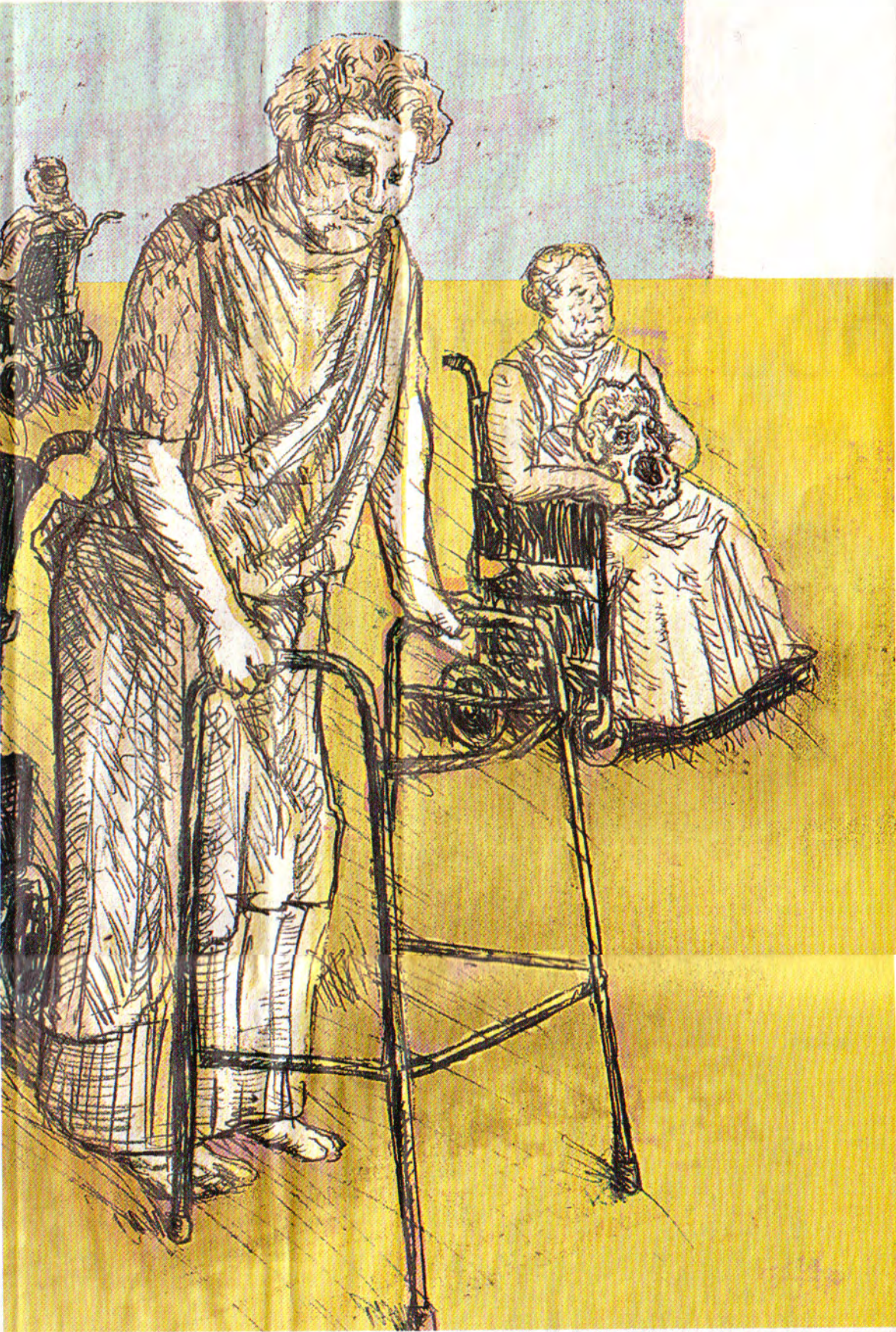
Εικονογράφηση: Αλέξανδρος Ανδριτσόπουλος (λεπτομέρεια)

» Μην ξεχνάτε ότι η Ευρώπη έχασε τη μάχη της παραγωγής αγαθών από την Ασία. Το μόνο που μπορεί να εξάγει είναι το ταλέντο και η δημιουργικότητα. Αυτά είναι η νέου τύπου οικονομία. Αν θέλετε να orthοποδέστε πρέπει να επενδύσετε σε υπηρεσίες που έχουν να κάνουν με τον πολιτισμό και τις τέχνες».